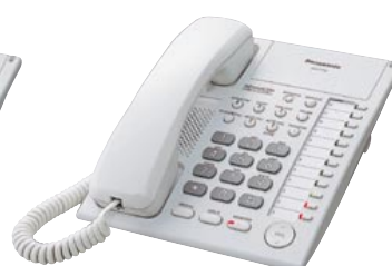
■ KX-T7750 Unidad con Monitor