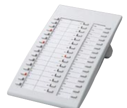
■ KX-T7740 Consola DSS