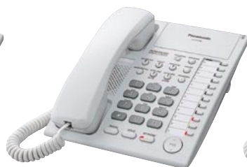
■ KX-T7720 Unidad con Altavoz