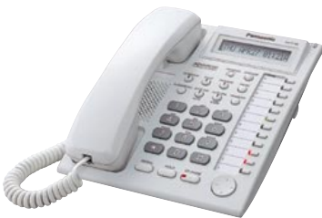
■ KX-T7730 Unidad con LCD y Altavoz