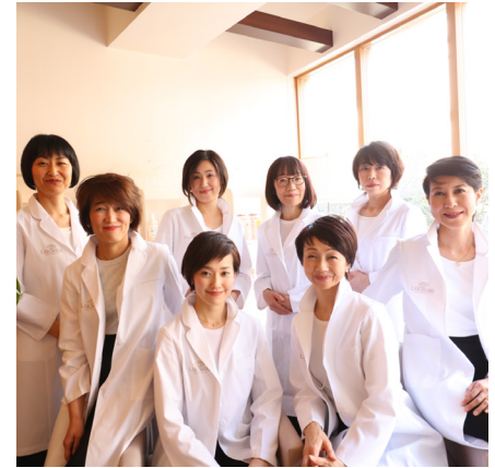
- Tokyo (Japan) June 2017