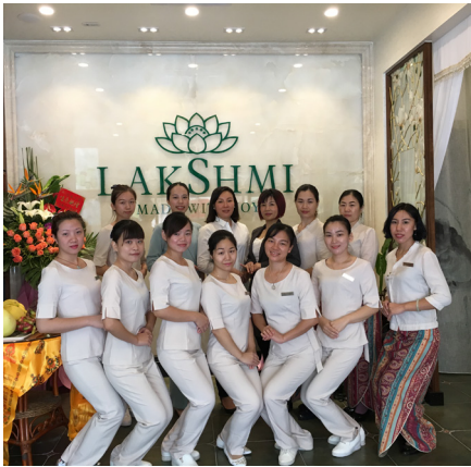
- Guangzhou (China) October 2016