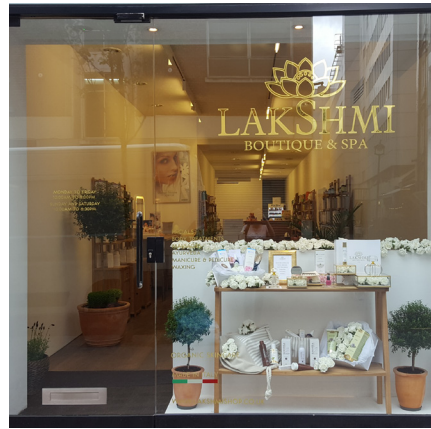
- London (Uk) May 2017