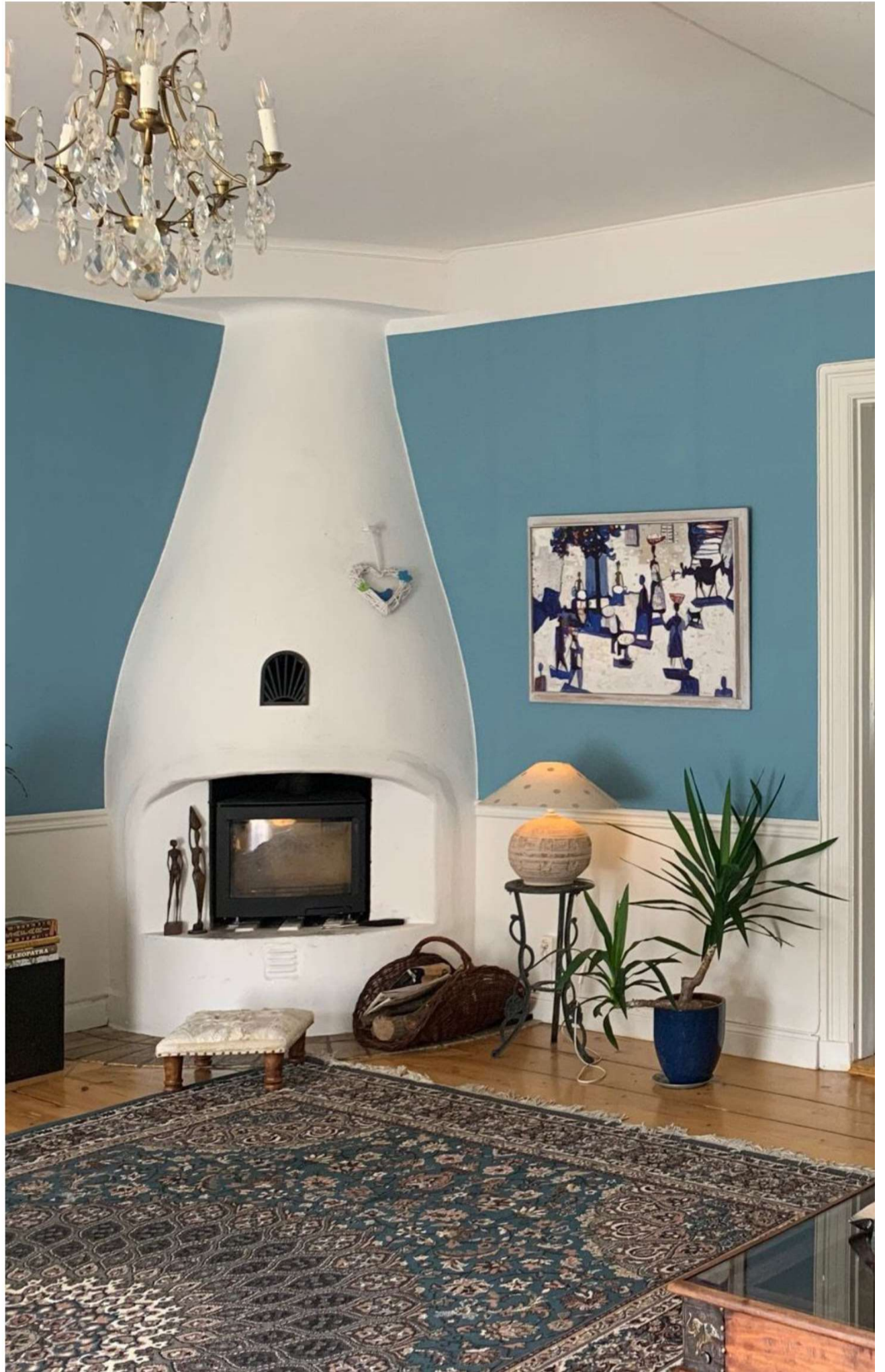
Vardagsrummet går i Karins favoritfärg, blått, och är ett av de största rummen i huset.