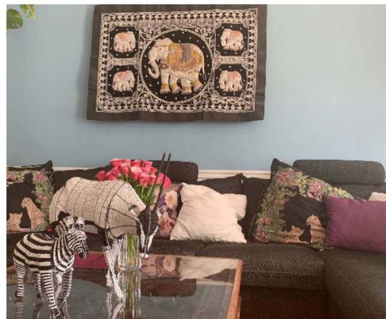
Djuren på bordet är gjorda av pärlor och är köpta i Namibia.