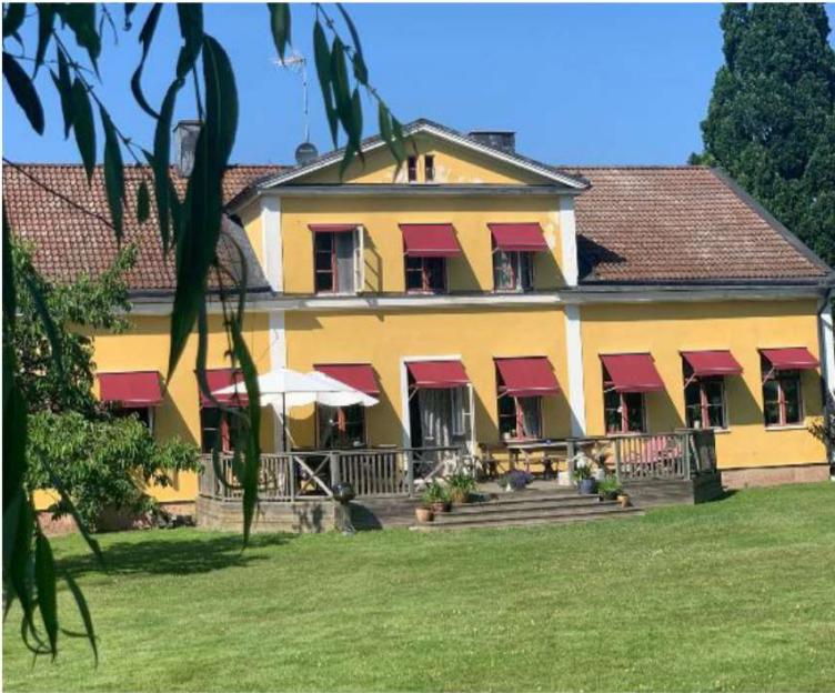
Karin beskriver uteplatsen mot Göta kanal som en del av husets hjärta.