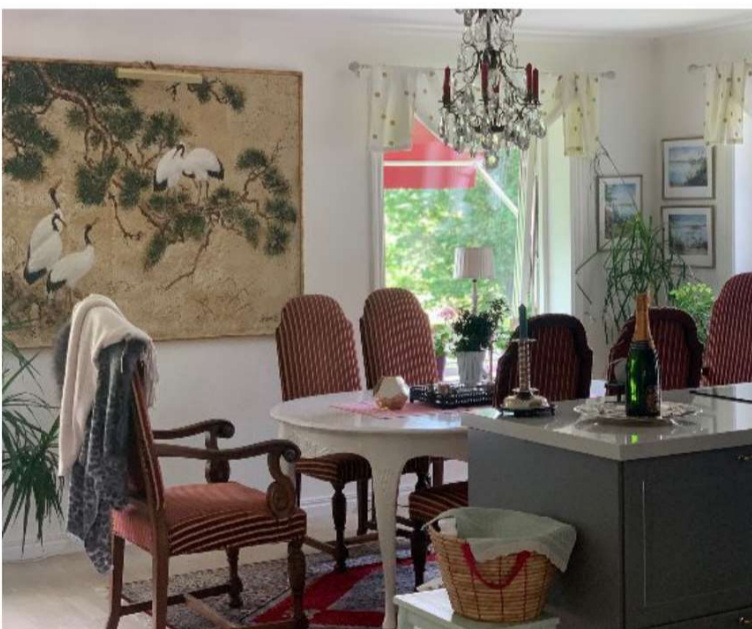
Matrummet där hennes föräldrar bor. Deras bostad sitter ihop med mansbyggnaden och var tidigare ett garage.