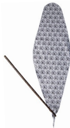
A32FG - CUERPO Y CABEZA DE FLAUTA MICROFIBRA (* ) VARILLA NO INCLUIDA