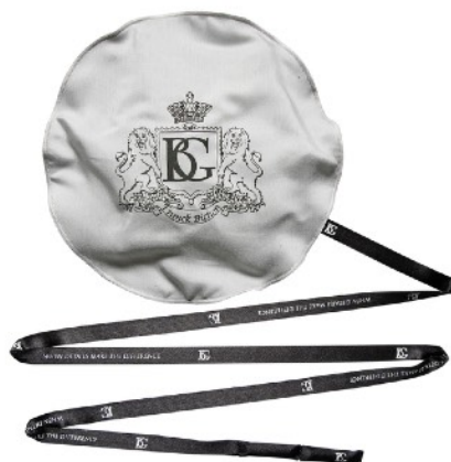
A30A - FLAUTA BAJA MICROFIBRA + SED Y BAMBÚ + GOMA ESPUMA