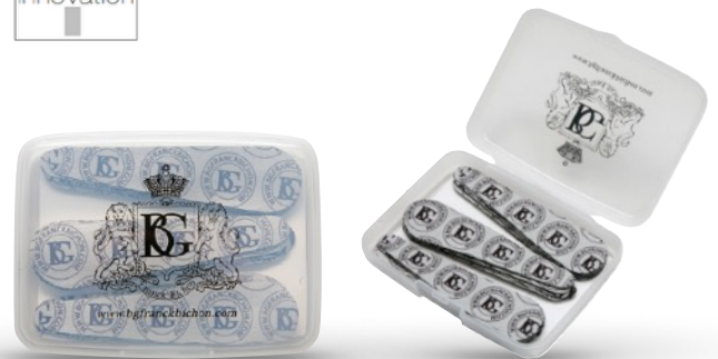
A65 UB - CAJA CON 20 UNIDADES REUTILIZABLE