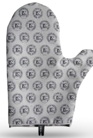
A62 G - GUANTE TALLA ÚNICA MICROFIBRA