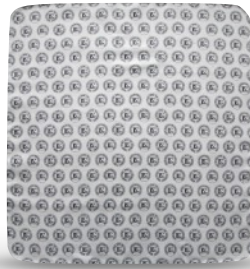
A62L - PAÑO DE LIMPIEZA 42 x 45 CM - 16.6 x 17.7 IN MICROFIBRA