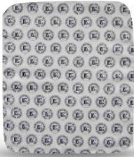
A62 - PAÑO DE LIMPIEZA 25 x 29 CM - 9.8 x 11.4 IN MICROFIBRA