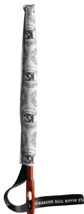
A39K - CUERPO Y CABEZA DE PICCOLO FORRO DE MICROFIBRA (* ) VARILLA NO INCLUIDA