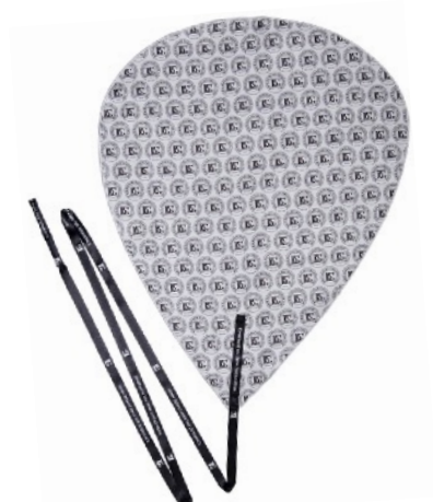
A32AF - CUERPO DE FLAUTA ALTO MICROFIBRA CON CORDÓN

EN BG, LA CALIDAD ES NUESTRA RAZÓN DE SER. NUESTRO PRINCIPIO: ¡NO VENDER LO QUE NOSOTROS NO COMPRARÍAMOS EN BG NOS ENORGULLECE QUE LOS LIMPIADORES SE ELABOREN EN LYON (FRANCIA) CON TEJIDOS DE CALIDAD Y SIN PRODUCTOS QUÍMICOS.