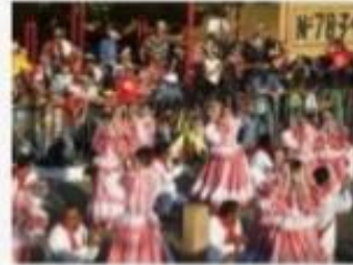
Dancing at the carnival

Name as inscribed on the World Heritage List