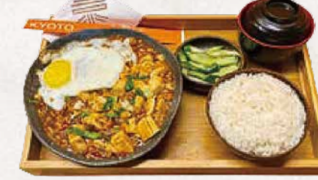
MAPO TOFU TEISHOKU 麻婆豆腐定食 R$58

Chahan: arroz frito com grãos longos, presunto, ervilhas e ovo. Karaage: frango frito crocante servido com molho agridoce.