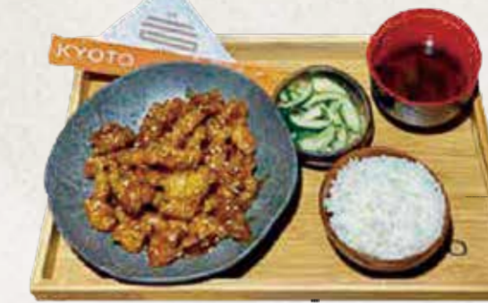
FRANGO AO MOLHO DE LARANJA TEISHOKU オレンジチキン定食 R$52

Lombo suíno empanado, servido salada de repolho com molho de gergelim e tomate fresco.