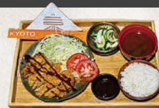
TONKATSU TEISHOKU とんかつ定食 R$52

Refeição completa no estilo japonês, acompanhada de gohan (arroz), missoshiru (sopa de missô) e tsukemono do dia (conserva japonesa).