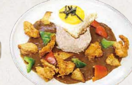
KARE FRANGO カツカレー R$56

lombo suíno empanado recheado com queijo muçarela, servido com curry japonês importado e gohan