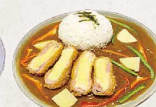
KARE CHEESE TONKATSU チーズカツカレー R$62

lombo suíno empanado e crocante, servido com curry japonês encorpado, cozido lentamente com pimentão e cebola, gohan