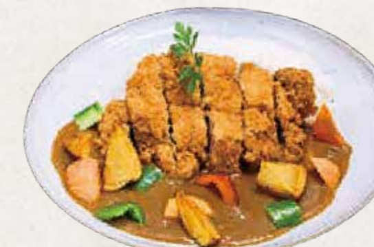
KARE TONKATSU カツカレー R$55

Nosso curry é importado do Japão — cremoso, levemente adocicado e cheio de umami.