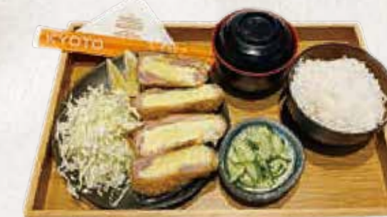
CHEESE TONKATSU TEISHOKU チーズとんかつ定食 R$62

Tonkatsu recheado com queijo muçarela, servido com salada de repolho fatiado ao molho de gergelim e tomate fresco.