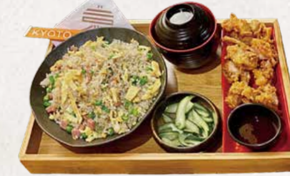
CHAHAN KARAAGUE TEISHOKU チャーハン唐揚げ定食 R$52

Chahan: Arroz de grão longo frito com presunto, ovo e ervilha. Gyoza: Massa artesanal recheada com carne suína, grelhada até ficar levemente crocante.