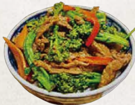
CARNE COM BRÓCOLIS 牛肉とブロッコリー炒め R$48

Frango grelhado com molho teriyaki, arroz e legumes do dia.