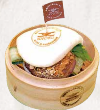
BAO TRADICIONAL 割包 R$32

Pão no vapor recheado com shimeji salteado, tofu frito e molho especial da casa.