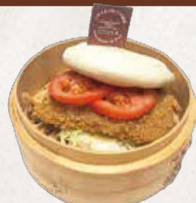
TONKATSU BAO とんかつバオ R$32

Pão no vapor recheado com tonkatsu crocante, molho tonkatsu, tomate fresco, repolho e molho de gergelim