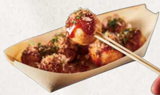
TAKOYAKI たこやき R$29

Rolinho crocante recheado com queijo OU carne suína temperada.