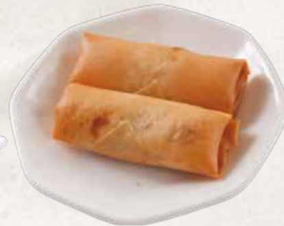
HARUMAKI IUN R$9

Sushi empanado recheado com kani e cream cheese, finalizado com molho tare e cebolinha.