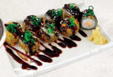
HOT ROLL KANI 揚げ巻き寿司 R$28

Frango frito crocante servido com molho agridoce.