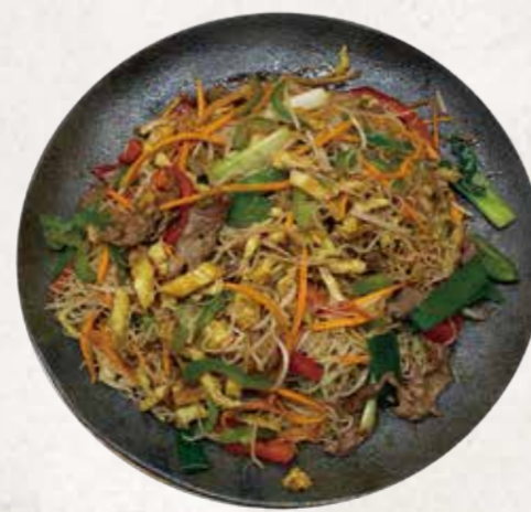
YAKIBIFUM 焼きビーフン R$52

Carne bovina fatiada, salteada no wok com brócolis e molho especial da casa.