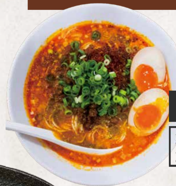
TANTANMEN 担々麺 R$48

Macarrão e caldo preparados artesanalmente pela nossa cozinha. Sabor japonês de verdade.