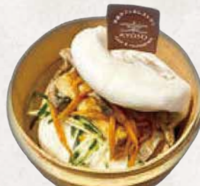
SHIMEJI TOFU BAO しめじ豆腐バオ R$32

Pão no vapor recheado com tonkatsu crocante, molho tonkatsu, tomate fresco, repolho e molho de gergelim