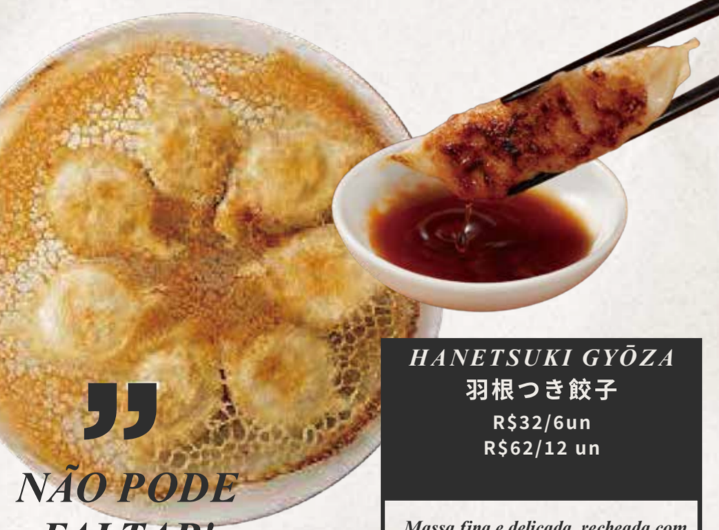
HANETSUKI GYŌZA 羽根つき餃子 R$32/6un R$62/12 un

Macarrão frito com carne, frango, legumes e molho da casa.