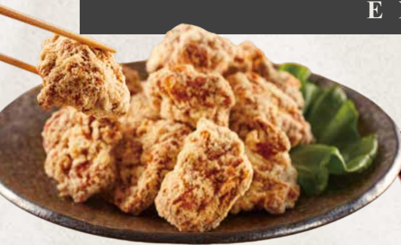
KARAAGUE 鶏の唐揚げ R$39

Frango frito crocante servido com molho agridoce.