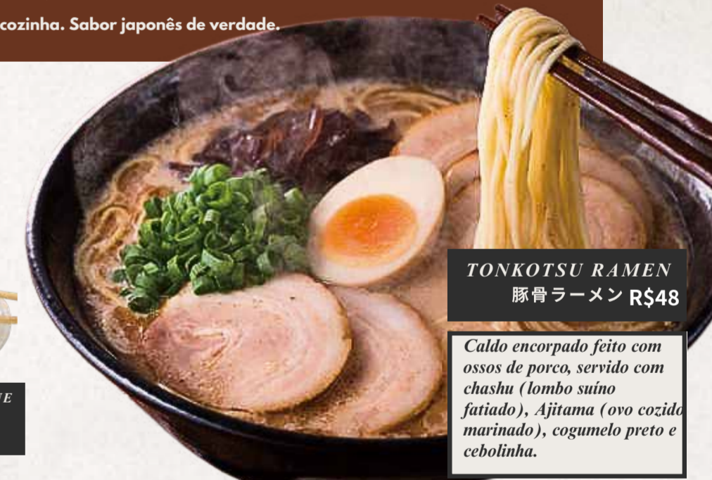
TONKOTSU RAMEN 豚骨ラーメン R$48

Caldo encorpado feito com ossos de porco, servido com chashu (lombo suíno fatiado), Ajitama (ovo cozido marinado), cogumelo preto e cebolinha.