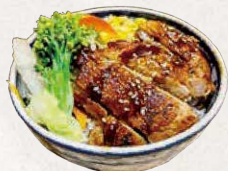
FRANGO TERIYAKI 鶏の照り焼き R$45

Frango grelhado com molho teriyaki, arroz e legumes do dia.