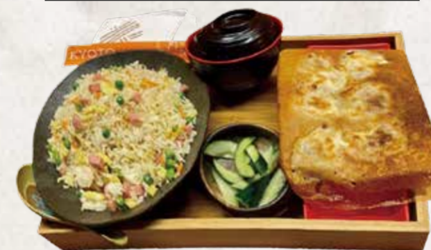
CHAHAN GYOZA TEISHOKU チャーハン餃子定食 R$63

Tonkatsu recheado com queijo muçarela, servido com salada de repolho fatiado ao molho de gergelim e tomate fresco.