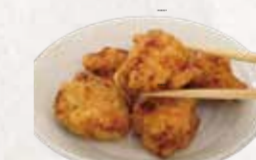
RAMEN+KARAAGUE COMBO R$58

Ramen picante com caldo tonkotsu, carne moída, Ajitama, cebolinha e cogumelo preto.