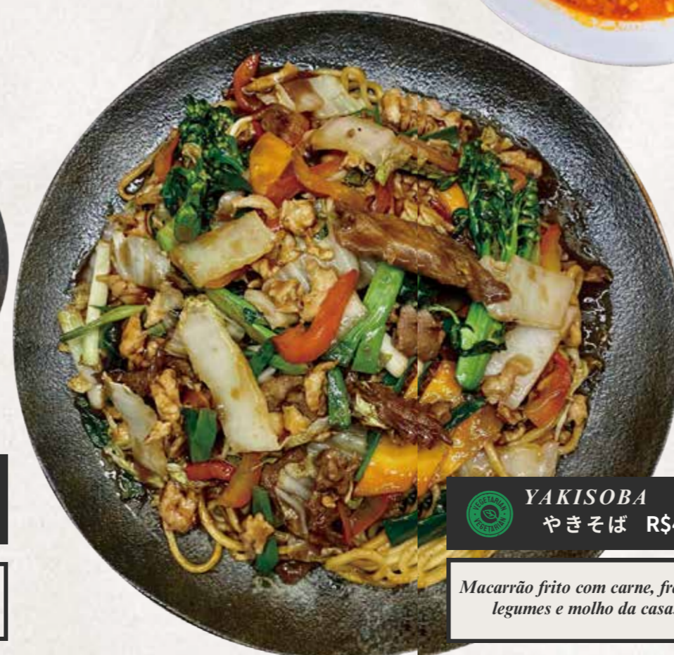
YAKISOBA やきそば R$48

Macarrão de arroz fino salteado com vegetais e bovino ao estilo oriental.