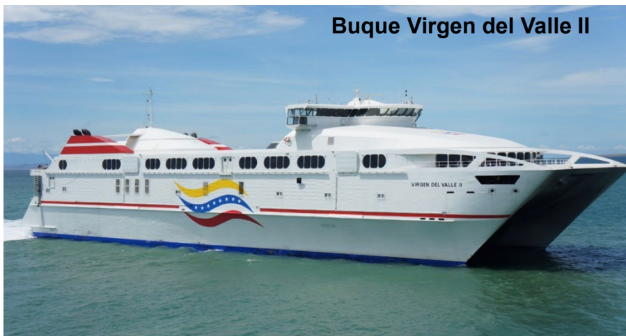
Buque Virgen del Valle II