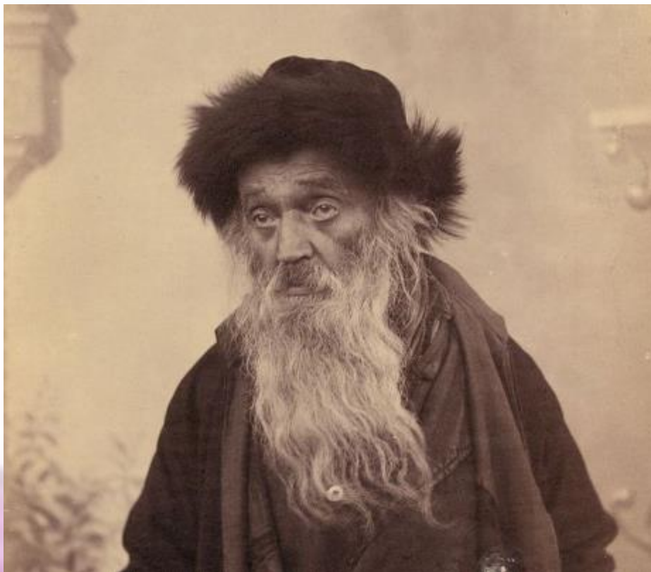
Foto Judío en 1900 en Jerusalén.

Se puede observar el sombrero, que eran casi exactos al de los gitanos.