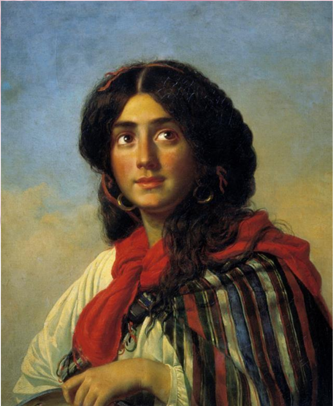
Doncella gitana con vestido tradicional, pintada en 1851. No se menciona el nombre del pintor.