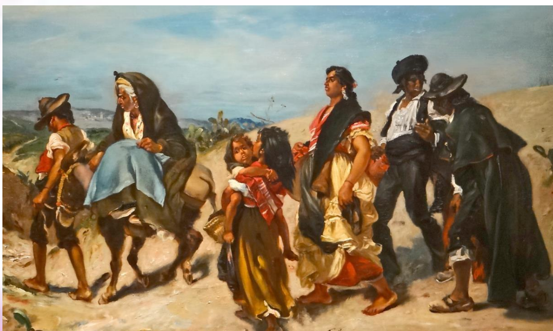
Alfred Dehodencq 1860

A la derecha figura un gitano, con un tipo de sombrero distinto. Puede ser que un gitano egipciano.