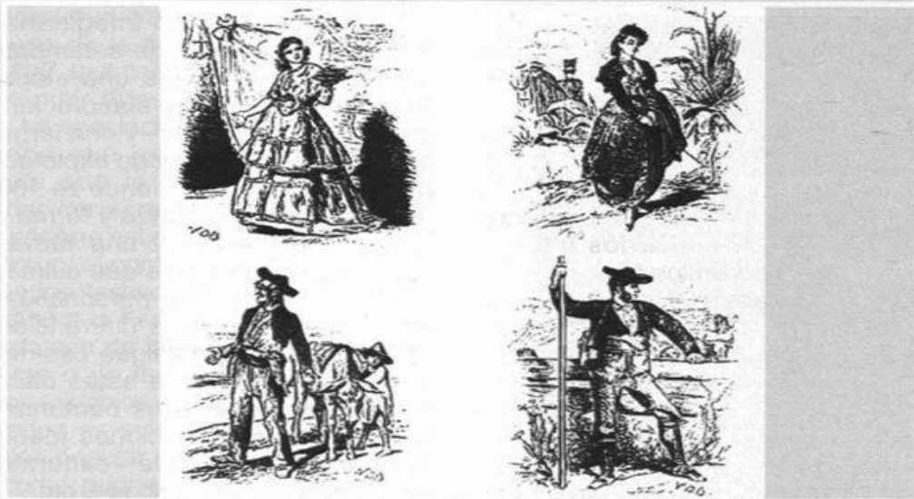
1869. V. Bécquer: Tipos andaluces en la feria de Sevilla . El Museo Universal 25-IV-1869.

los cuales se dirigían a la rica ciudad de Arras. Su piel muy oscura, la barba cubría el rostro de los varones, su idioma desconocido, las mujeres llevaban un turbante en la cabeza y anillos en las orejas. Sus ropas flácidas flotaban en el aire