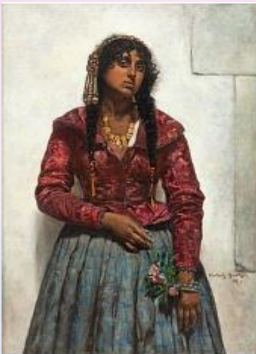
Mujer romaní con vestido tradicional, por Konstanty Mańkowski, 1887

Todos los datos históricos nos indican que EN TODO EL TIEMPO ANTES DE SER PROHIBIDAS, LOS GITANOS VESTÍAN SUS ROPAS TRADICIONALES.