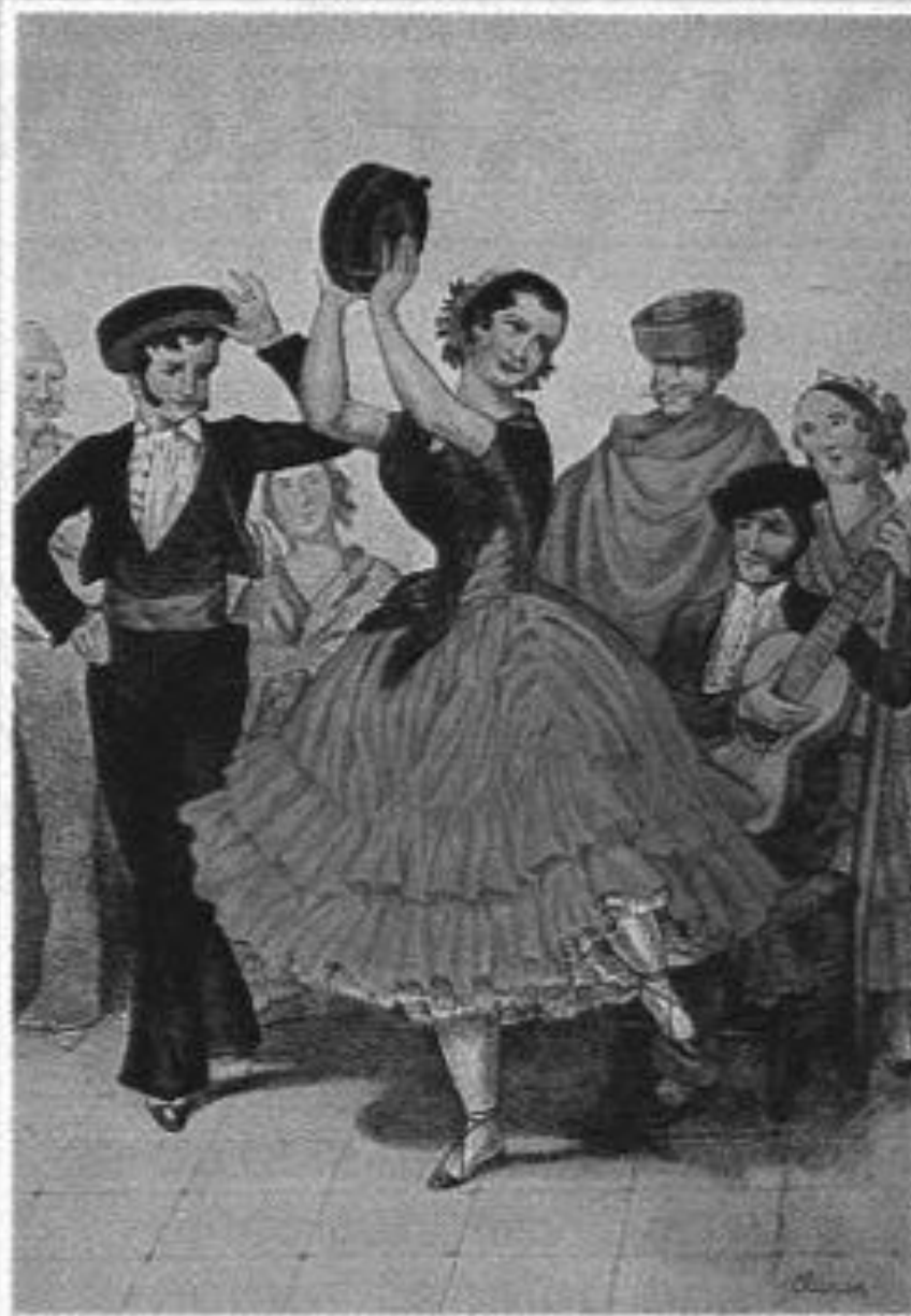
1849 La Feria de Sevilla. Baile del vito. Colección de Grabados de Santi-gosa.

El baile del vito fue un baile flamenco gitano, el ruso Mijaíl Glinka que era un músico extraordinario le pondría música en 1845 en su viaje a Granada.