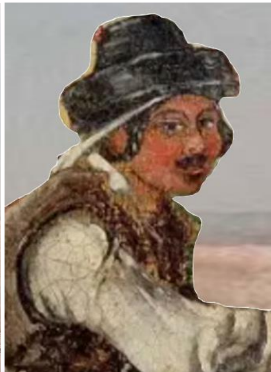
Gitano pintado por Francis William 1855.