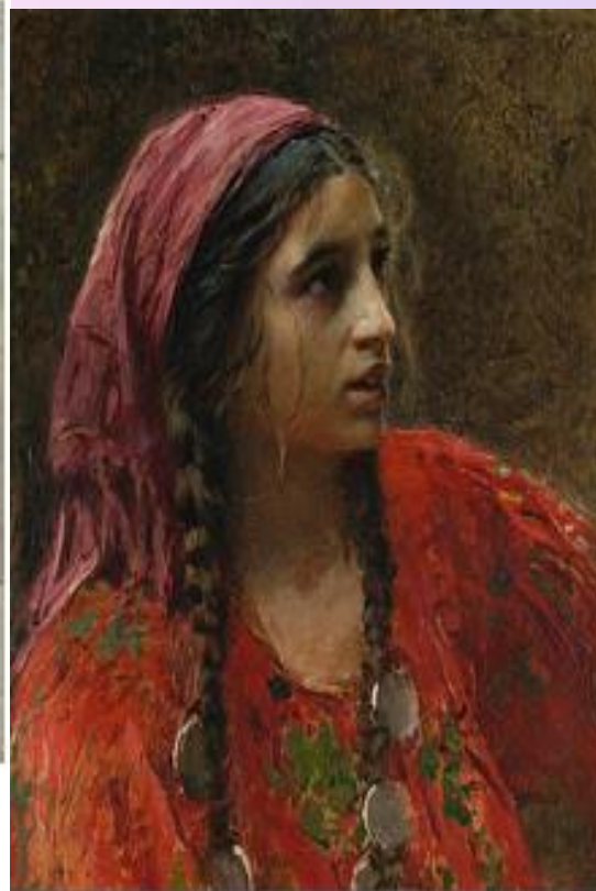
Chica romaní, de Konstantin Makovsky

Las gitanas, aún a día de hoy se ponen el tradicional pañuelo judío de mujer casada.