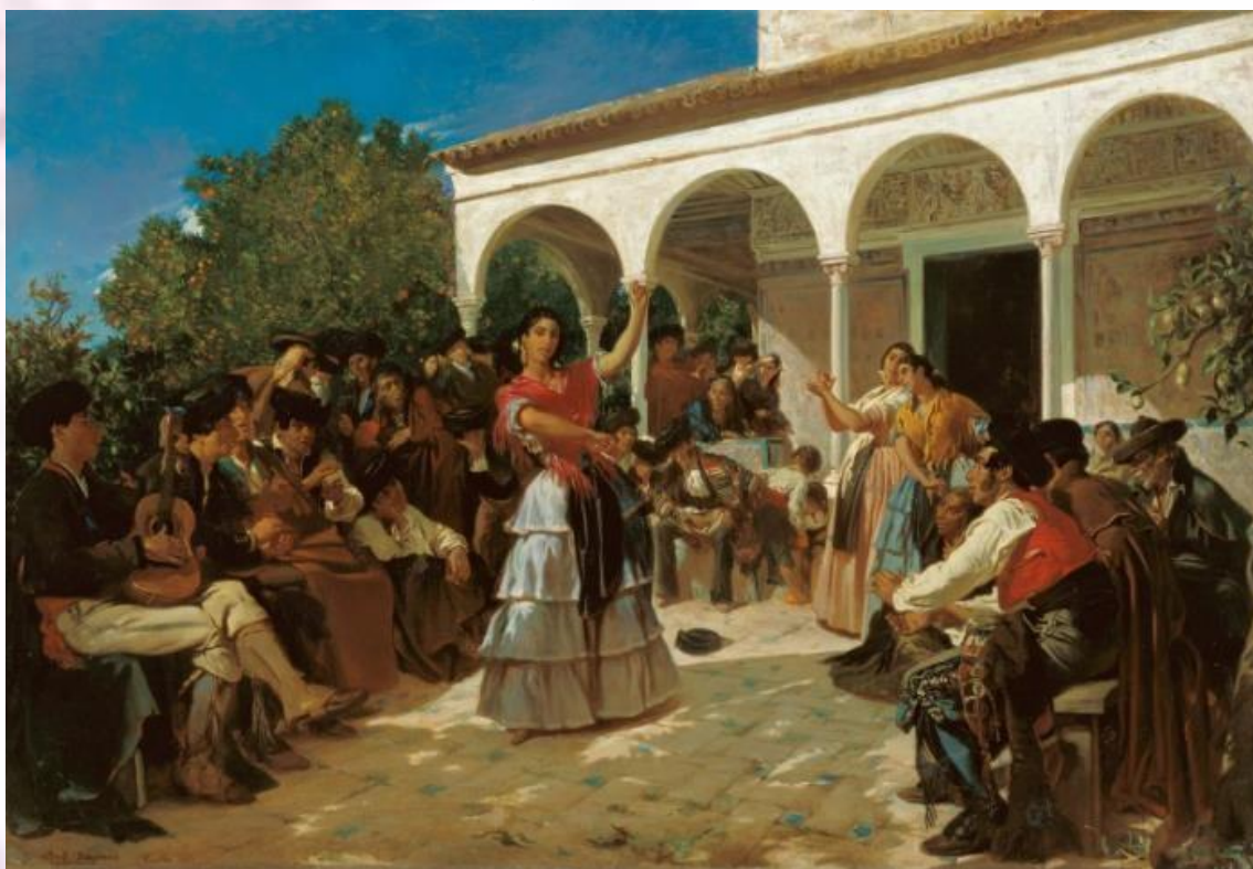
Baile de gitanos jardines del Alcazar. Alfred de Hodencq, 1851.

Isabel Burton, escritora inglesa, realizó una comparativa de los sombreros de los gitanos bohemios de España, y los comparó con los judíos de Polonia de la misma época.