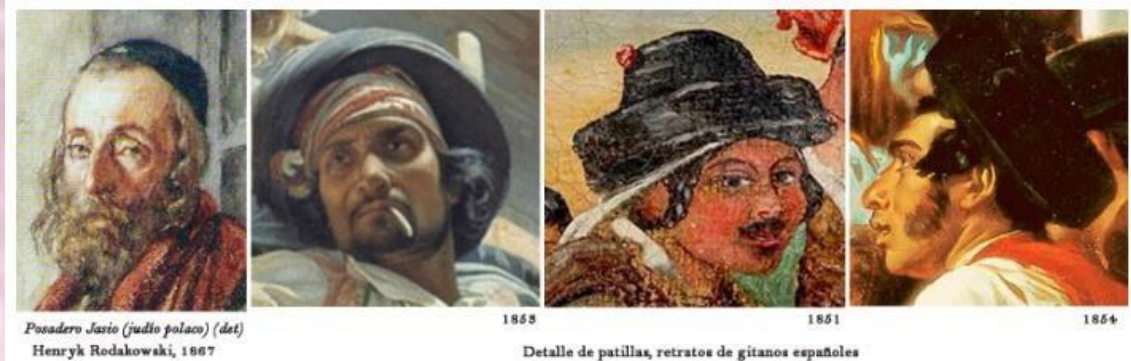
Posadero Jasio (judío polaco) (det) Henryk Rodakowski, 1867

El cuadro mostrado más arriba de Francis William muestra el típico sombrero judío incluido los tirabuzones: