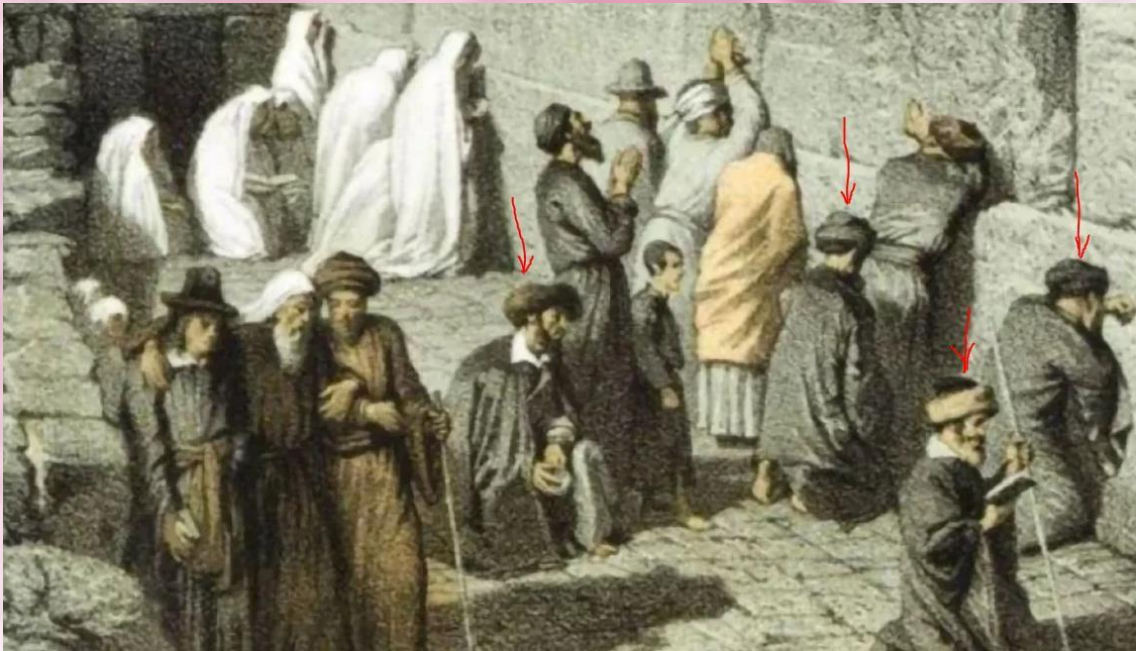
Pintura judíos orando, representa al siglo XVIII. Se puede observar los sombreros judíos son Igual al que llevaban los gitanos.