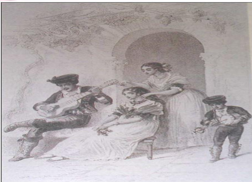
Le dimanche matin à Grenade. Rouargue, 1859. Biblioteca Cánovas del Castillo. Málaga.