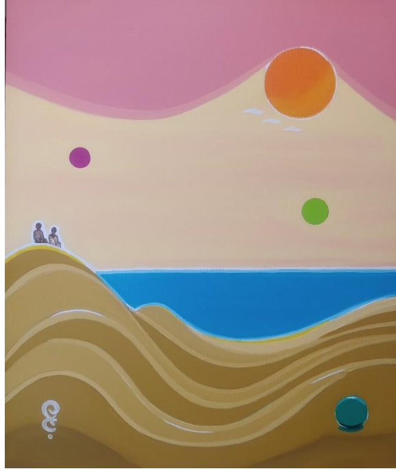
Gravity I - B. 2021

50 * 60 cm. Tuval üzerine yağlı boya / oil on canvas