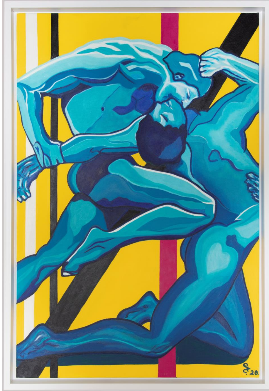
Dante and Vergilius.-

Homage to William Adolphe Bouguereau's Dante and Vergilius in Hell.