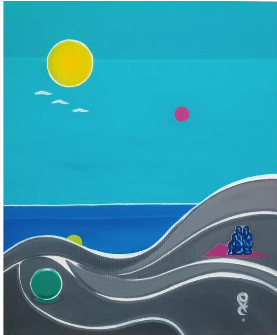
Gravity II - B. 2021

50 * 60 cm. Tuval üzerine yağlı boya / oil on canvas