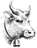
बैलाच्या गळ्यांतील घुंगूरमाळा