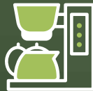
Café e infusiones