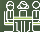
Sala de juntas