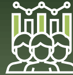
Sala de Trading