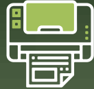
Impresión y scanner