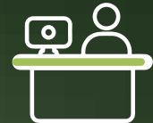
Recepción de correspondencia