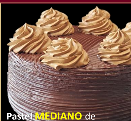
Pastel MEDIANO de CHOCOLATE

PASTEL A BASE DE CACAO GOURMET. 0% AZÚCAR 100% SABOR.