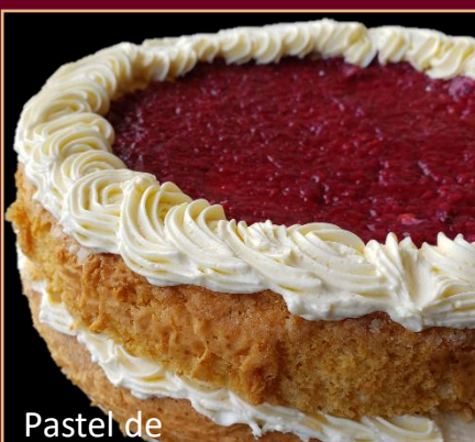
Pastel de MORA

PASTEL DE MORA, CON UN PERFECTO EQUILIBRIO ENTRE EL DULCE Y LO CÍTRICO. "ELABORADO SIN LECHE" Y 0% AZÚCAR, RELLENO Y CORONADO CON MERMELEDA DE MORA.