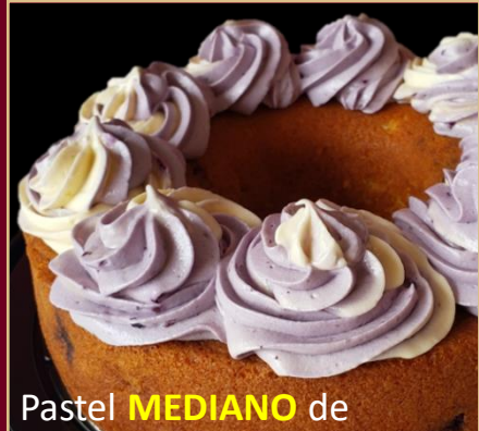
Pastel MEDIANO de BLUEBERRY SIN GLUTEN

PASTEL DE BLUEBERRY A A BASE DE HARINA DE ALMENDRAS, COCO Y BLUEBERRY (arándanos). 0% AZÚCAR 100% SABOR. TAMAÑO MEDIANO