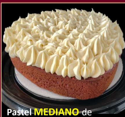
Pastel MEDIANO de RED VELVET CORAZÓN

PASTEL A BASE DE QUESO MASCARPONE Y CACAO GOURMET. 0% AZÚCAR 100% SABOR.