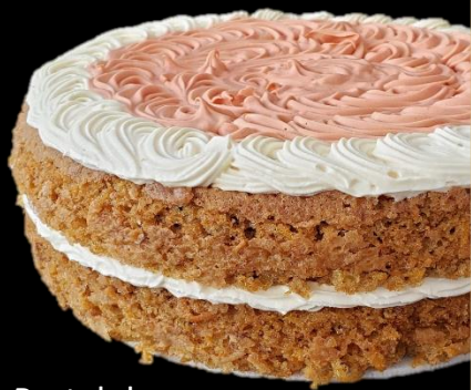
Pastel de ZANAHORIA Y NUECES

PASTEL A BASE DE ZANAHORIA Y NUECES, ELABORADO SIN SABORIZANTE.