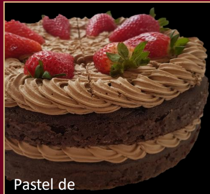
Pastel de CHOCOLATE

PASTEL A BASE DE CACAO GOURMET. 0% AZÚCAR 100% SABOR.