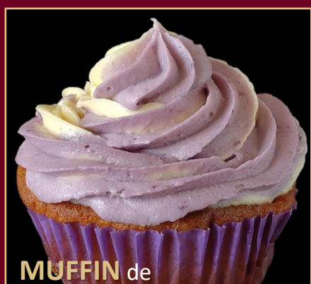
MUFFIN de BLUEBERRY

DELICIOSO MUFFIN "SIN GLUTEN", ELABORADO CON HARINA DE ALMENDRAS Y HARINA DE COCO, BLUEBERRY Y CORONADO CON UN FROSTING DE QUESO CREMA. 0% AZÚCAR 100% SABOR.