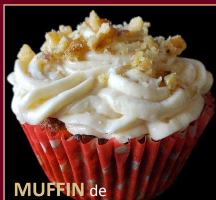
MUFFIN de ZANAHORIA Y NUECES

DELICIOSO MUFFIN "SIN GLUTEN", ELABORADO CON HARINA DE ALMENDRAS Y HARINA DE COCO, NUECES Y CORONADO CON UN FROSTING DE QUESO CREMA. 0% AZÚCAR 100% SABOR.