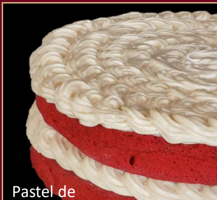
Pastel de RED VELVET

PASTEL A BASE DE QUESO MASCARPONE Y CACAO GOURMET. 0% AZÚCAR 100% SABOR.