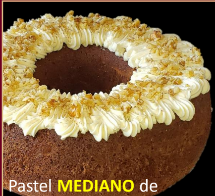
Pastel MEDIANO de ZANAHORIA y NUECES SIN GLUTEN

PASTEL DE ZANAHORIA A BASE DE HARINA DE ALMENDRAS Y COCO. CONTIENE NUECES. 0% AZÚCAR 100% SABOR. TAMAÑO MEDIANO