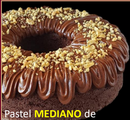
Pastel MEDIANO de CHOCOLATE y MANÍ SIN GLUTEN

PASTEL DE CHOCOLATE A BASE DE HARINA DE ALMENDRAS Y COCO. CONTIENE CACAO Y MANÍ. 0% AZÚCAR 100% SABOR. TAMAÑO MEDIANO