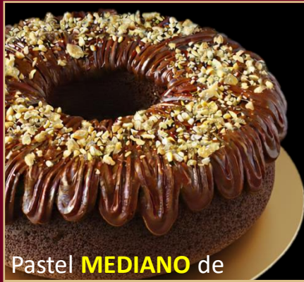
Pastel MEDIANO de CHOCOLATE y MANÍ SIN GLUTEN

PASTEL DE CHOCOLATE A BASE DE HARINA DE ALMENDRAS Y COCO. CONTIENE CACAO Y MANÍ. 0% AZÚCAR 100% SABOR. TAMAÑO MEDIANO