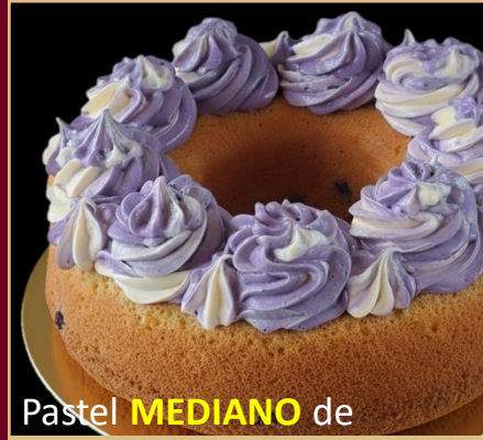
Pastel MEDIANO de BLUEBERRY SIN GLUTEN

PASTEL DE BLUEBERRY A A BASE DE HARINA DE ALMENDRAS, COCO Y BLUEBERRY (arándanos). 0% AZÚCAR 100% SABOR. TAMAÑO MEDIANO