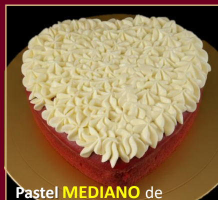
Pastel MEDIANO de RED VELVET CORAZÓN

PASTEL A BASE DE QUESO MASCARPONE Y CACAO GOURMET.