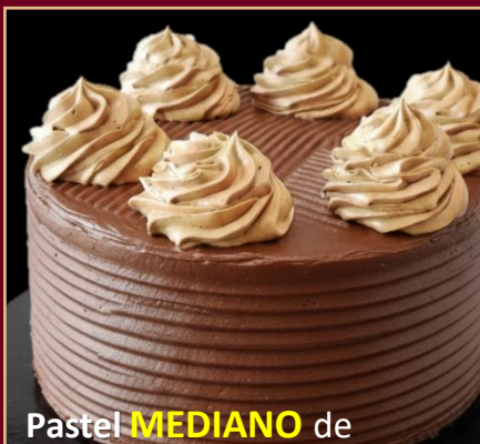
Pastel MEDIANO de CHOCOLATE