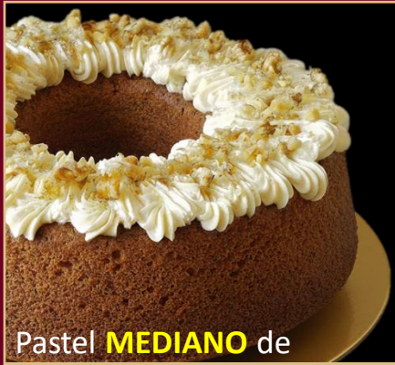
Pastel MEDIANO de ZANAHORIA y NUECES SIN GLUTEN

PASTEL DE ZANAHORIA A BASE DE HARINA DE ALMENDRAS Y COCO. CONTIENE NUECES. 0% AZÚCAR 100% SABOR. TAMAÑO MEDIANO