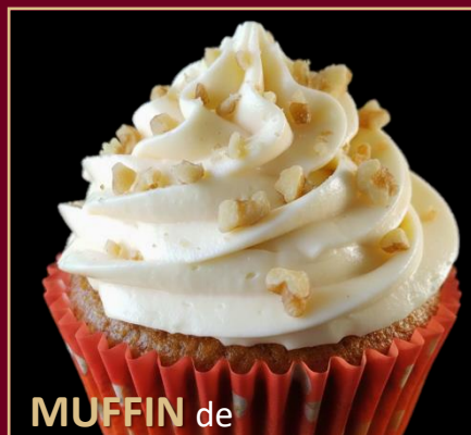
MUFFIN de ZANAHORIA Y NUECES

DELICIOSO MUFFIN "SIN GLUTEN", ELABORADO CON HARINA DE ALMENDRAS Y HARINA DE COCO, NUECES Y CORONADO CON UN FROSTING DE QUESO CREMA. 0% AZÚCAR 100% SABOR.