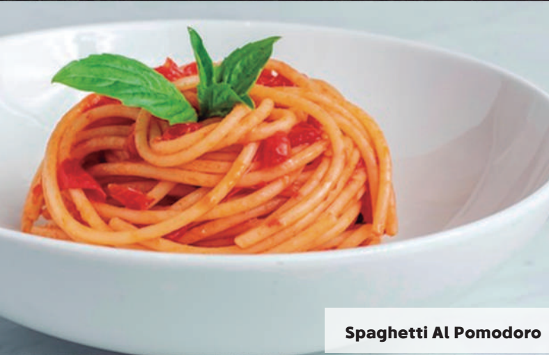
Spaghetti Al Pomodoro