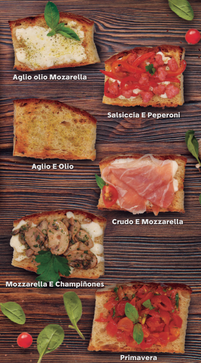
Aglio olio Mozzarella