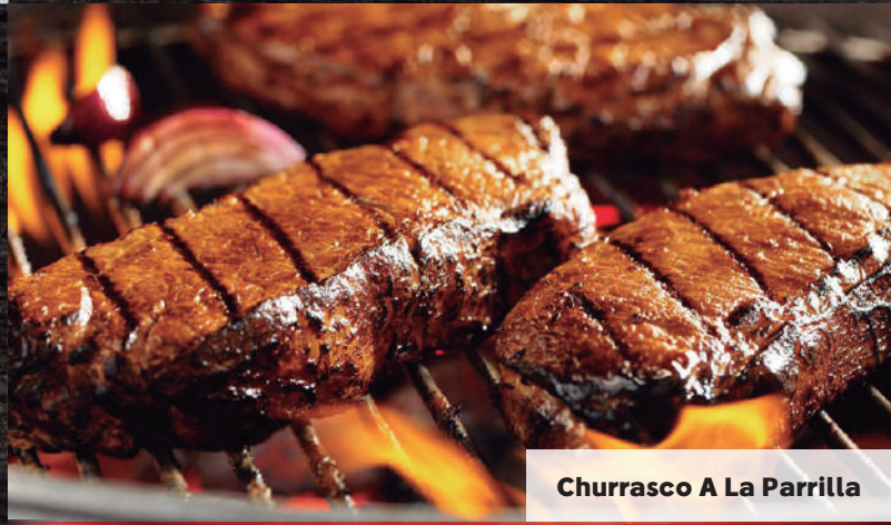
Churrasco A La Parrilla