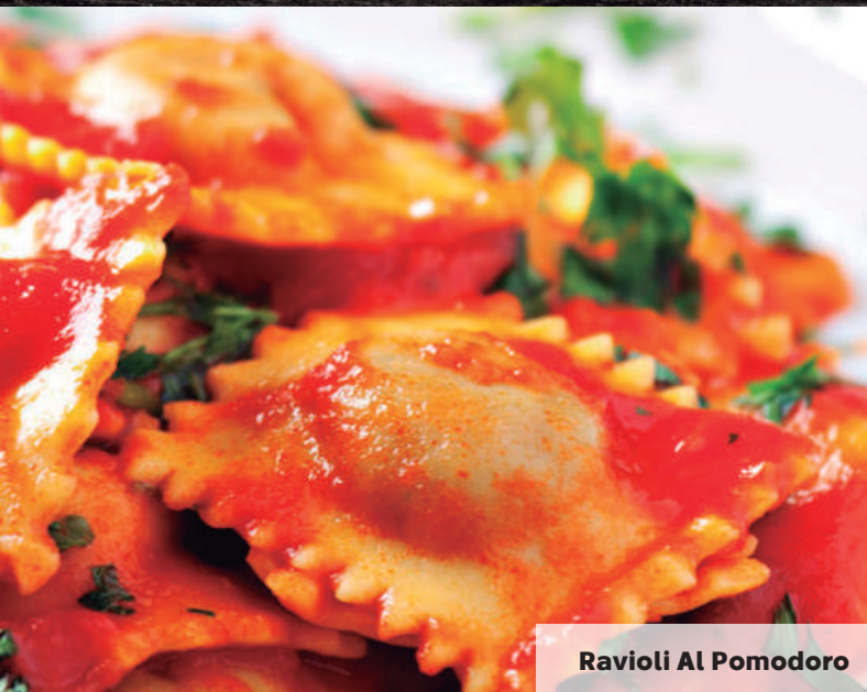
Ravioli Al Pomodoro