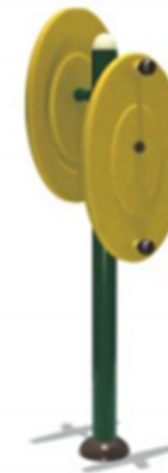
NB-01203 TAICHI 60*50*200 CM RD$ 37,050.00 (IMPUESTOS INCLUIDOS)