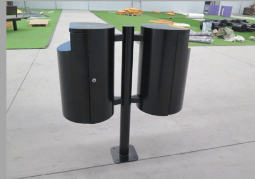
TG - 0805 ZAFACON BERLIN 88*36*100cm RD$ 25,650.00