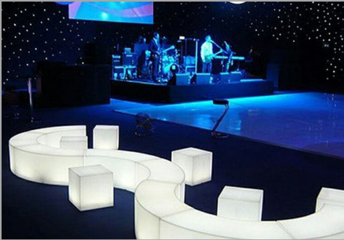
TG - 0729 SILLON LED 178*38*40cm EN FORMA DE U TG - 0730 SILLON LED 45*40cm OTOMAN RD$ 28,500.00 (IMPUESTOS INCLUIDOS) (COLOR GRIS) RD$ 8,550.00 (IMPUESTOS INCLUIDOS) (COLOR GRIS)