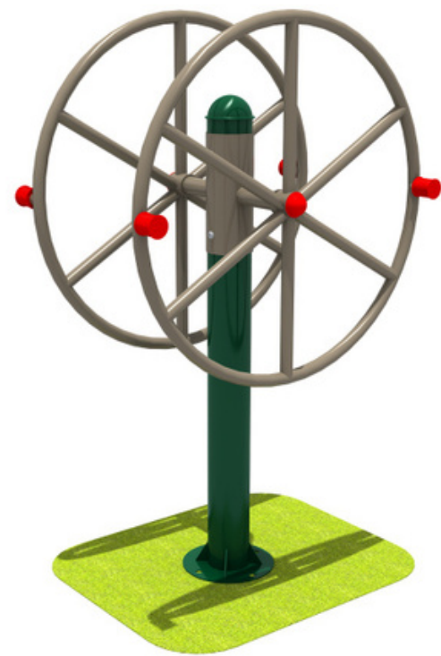
HD-76-21253 EQ. TAICHI 80*50*165 cm RD$ 37,050.00 (IMPUESTOS INCLUIDOS)