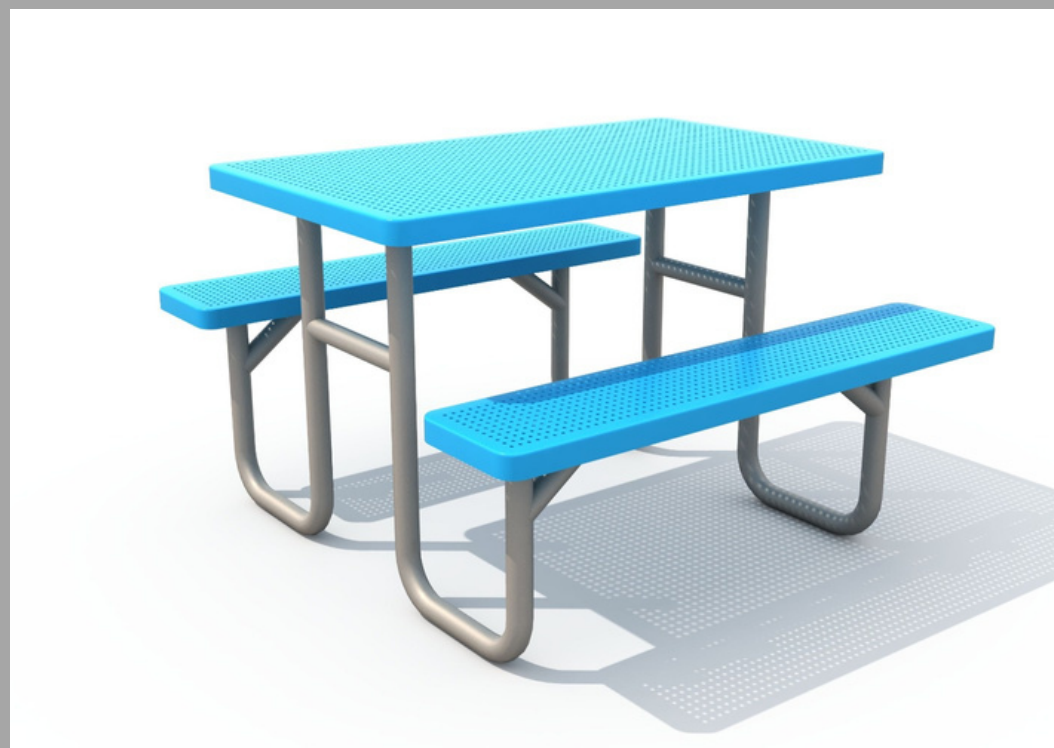
FY-17603-2 BANCO MERENDERO PARA NIÑOS 90*82.5*53.5 CM RD$ 27,075.00(IMPUESTOS INCLUIDOS)