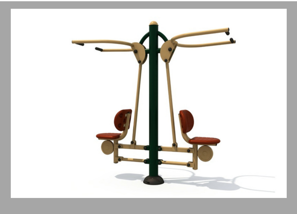
FY-11701 FORTALECEDOR DE PECHO DOBLE 193*75*190 CM RD$ 105,000.00 (IMPUESTOS INCLUIDOS)