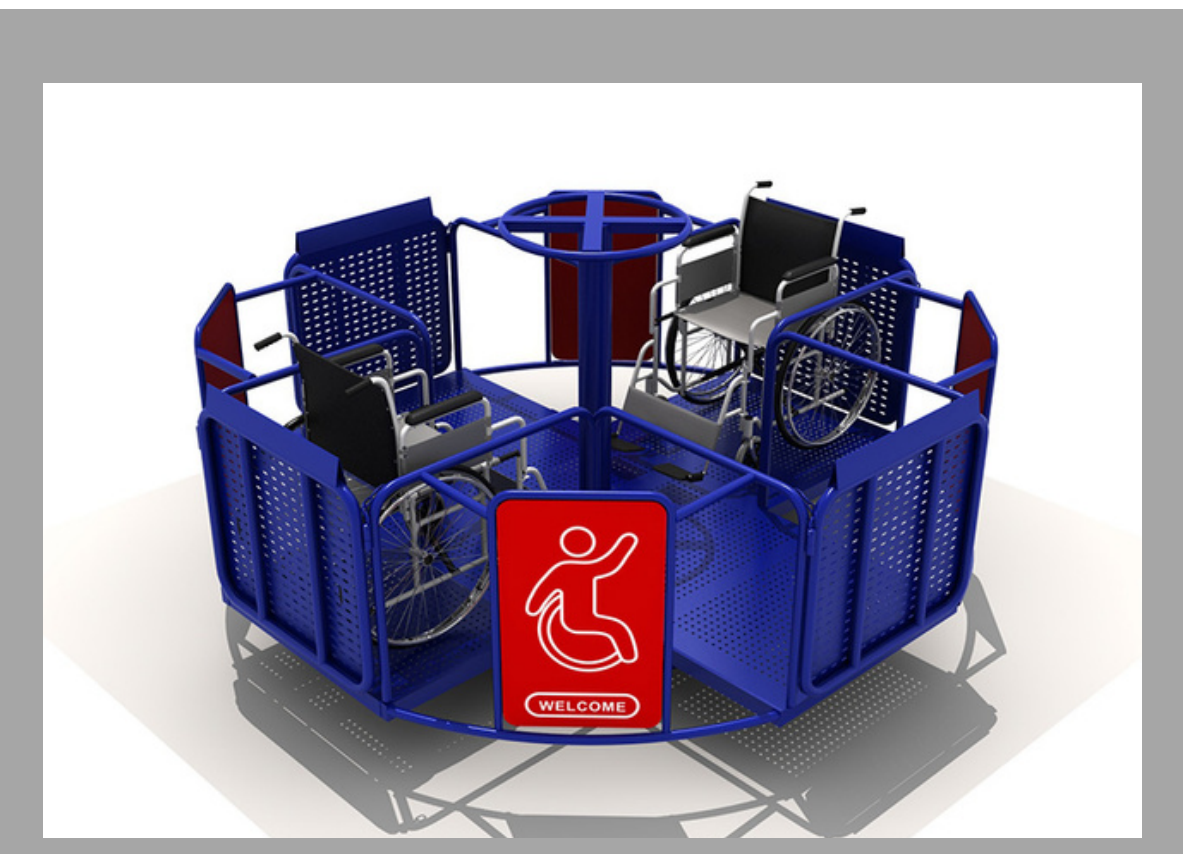
FY-12411 CARRUSEL INCLUSIVO 150*150*110 CM RD$ 160,000.00 (IMPUESTOS INCLUIDOS)