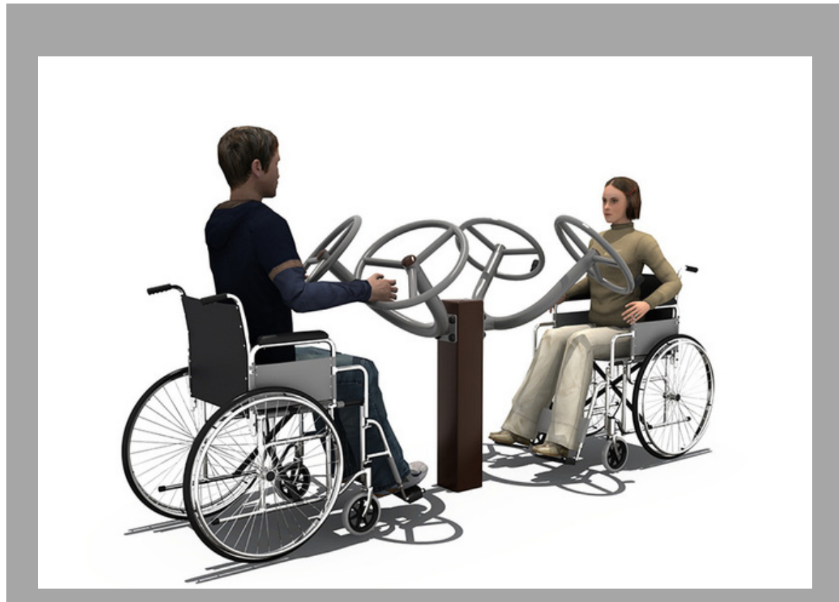
FY-12307 EQUIPO PARA PERSONAS CON DISCAPACIDAD 138*105*120 CM RD$ 55,575.00 (IMPUESTOS INCLUIDOS)