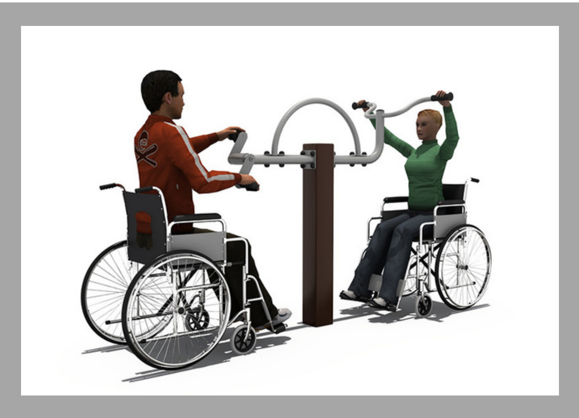
FY-12302 EQUIPO PARA PERSONAS CON DISCAPACIDAD 138*54*148 CM RD$ 62,700.00 (IMPUESTOS INCLUIDOS)