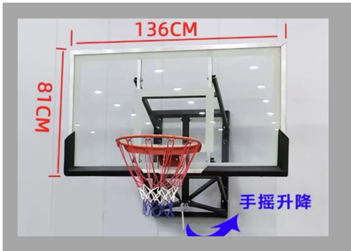
JQ-1812 ARO DE BASKETBALL 136*81 cm RD$ 31,350.00 C/U (IMPUESTOS INCLUIDOS)