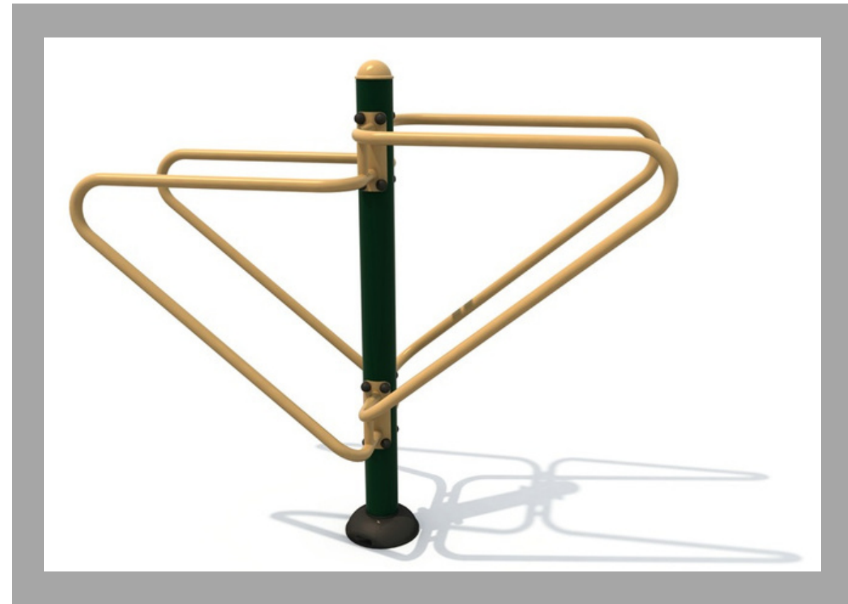
FY-11812 BARRAS PARALELAS DOBLES 180*63*160 CM RD$ 48,450.00 (IMPUESTOS INCLUIDOS)