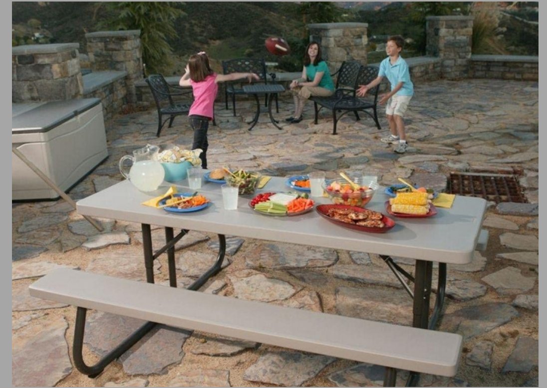
AL-03C BANCO PARA ADULTOS RD$ 21,090.00 (IMPUESTOS INCLUIDOS)