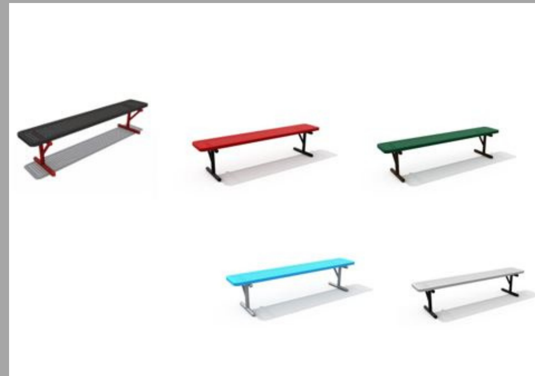
FY-17501 BANCO DE METAL 150*40*45 CM RD$ 15,675.00 (IMPUESTOS INCLUIDOS)