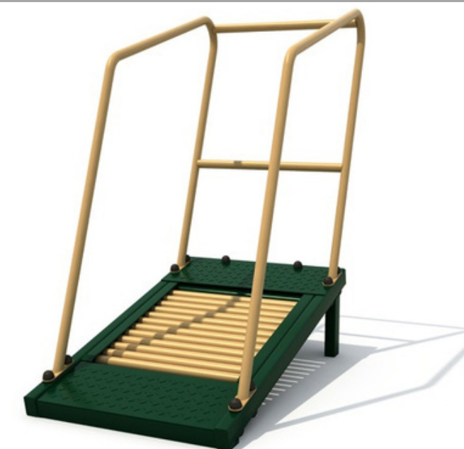
FY-12008 CAMINADORA 132*66*120 CM RD$ 65,550.00 (IMPUESTOS INCLUIDOS)