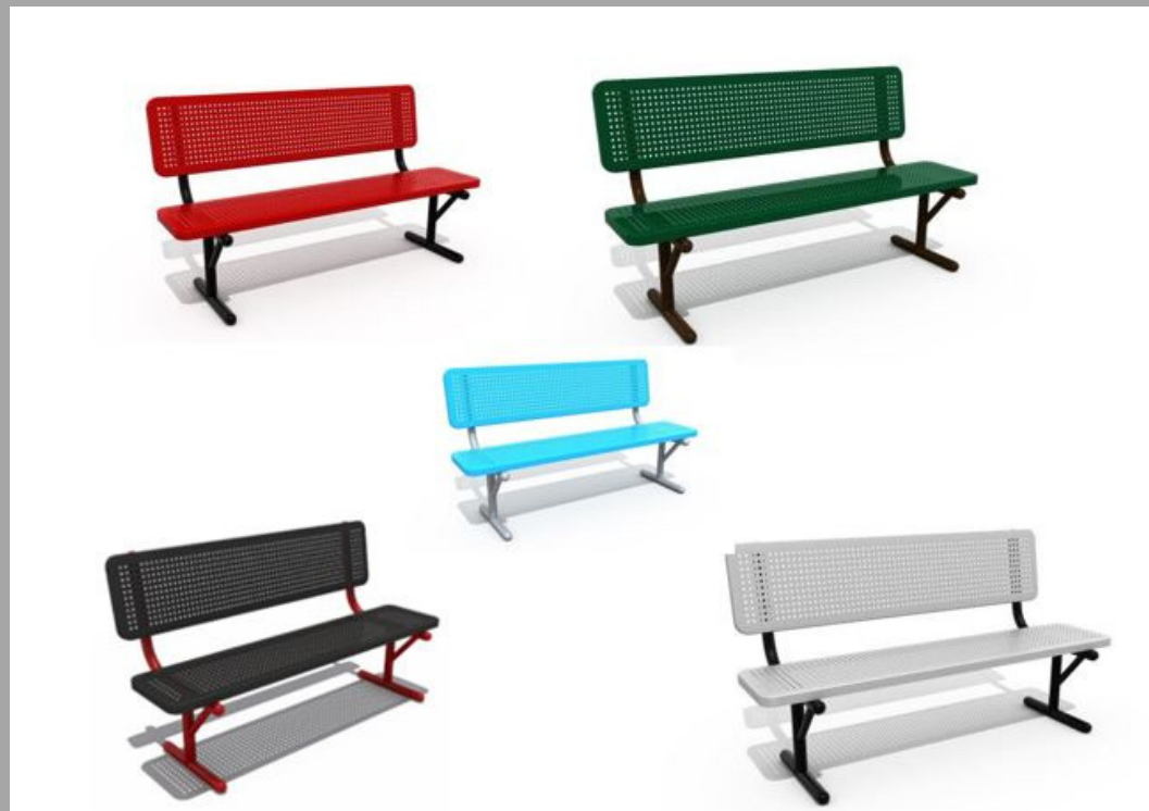
FY-17502 BANCO DE METAL 150*65*86CM RD$ 21,945.00 (IMPUESTOS INCLUIDOS)