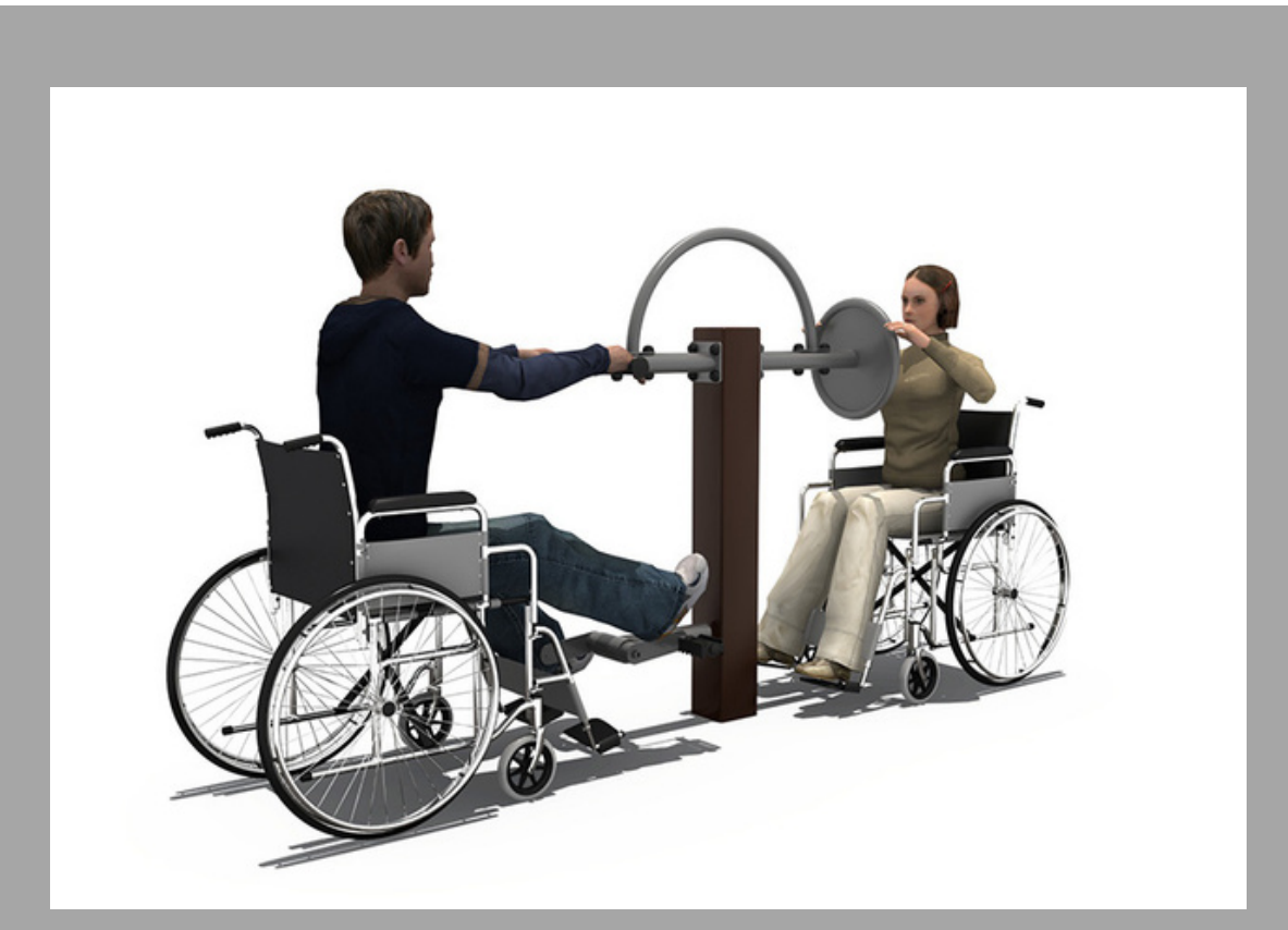
FY-12306 EQUIPO PARA PERSONAS CON DISCAPACIDAD 115*55*148 CM RD$ 49,875.00 (IMPUESTOS INCLUIDOS)