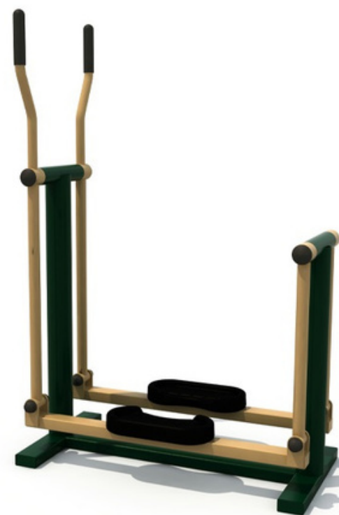
FY-11706 SIMULADOR JET SKI 90*55*148 CM RD$ 54,150.00 (IMPUESTOS INCLUIDOS)