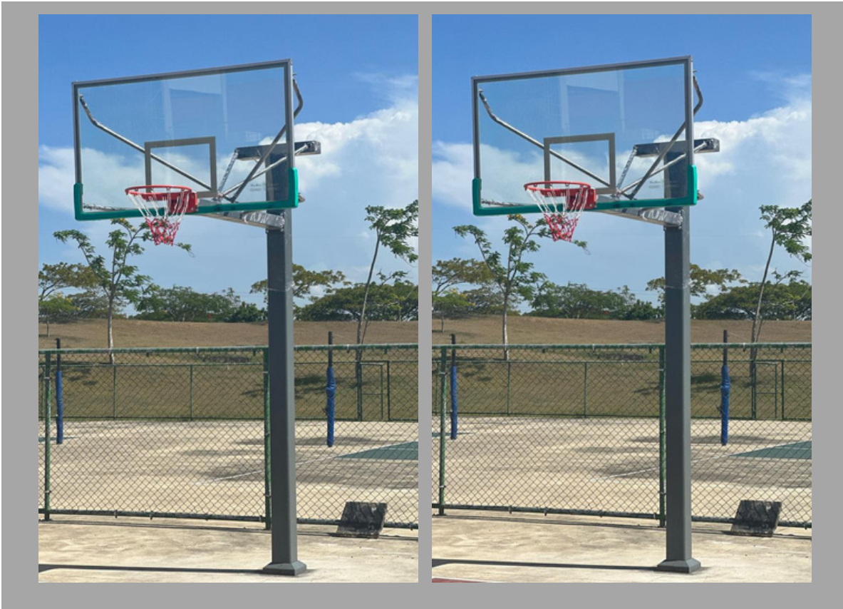
TG-1011 ARO DE BASKETBALL 1.8 * 1.05m *: 3.05m RD$ 101,175.00 C/U (IMPUESTOS INCLUIDOS)