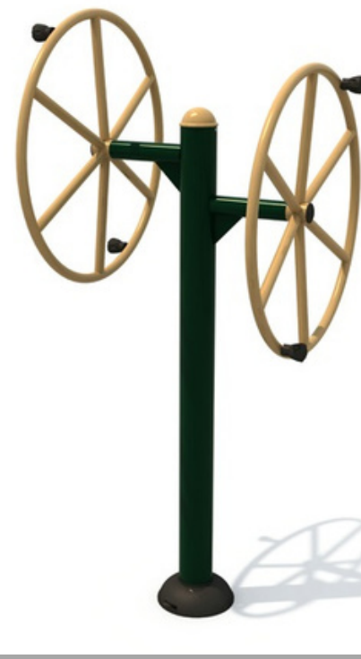
FY-11901 TAICHI 87*78*194 CM RD$ 48,450.00 (IMPUESTOS INCLUIDOS)