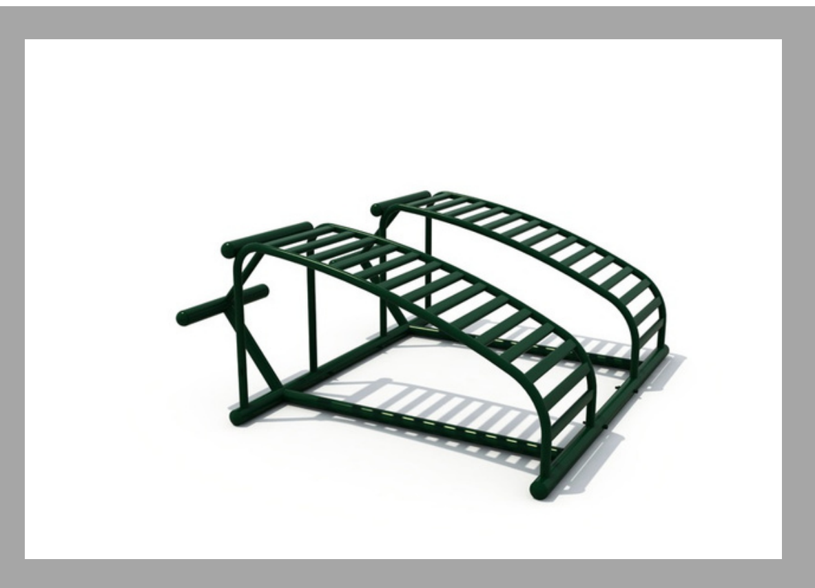
FY-11911 EQUIPO PARA ABDOMINALES DOBLE 160*150*68 CM RD$ 80,940.00 (IMPUESTOS INCLUIDOS)