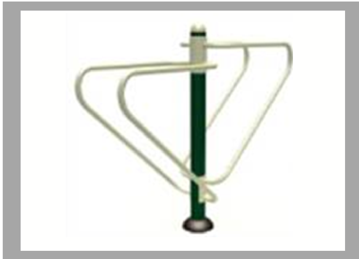
NB-00905 BARRAS PARALELAS DOBLES 80*55*160 CM RD$ 34,200.00