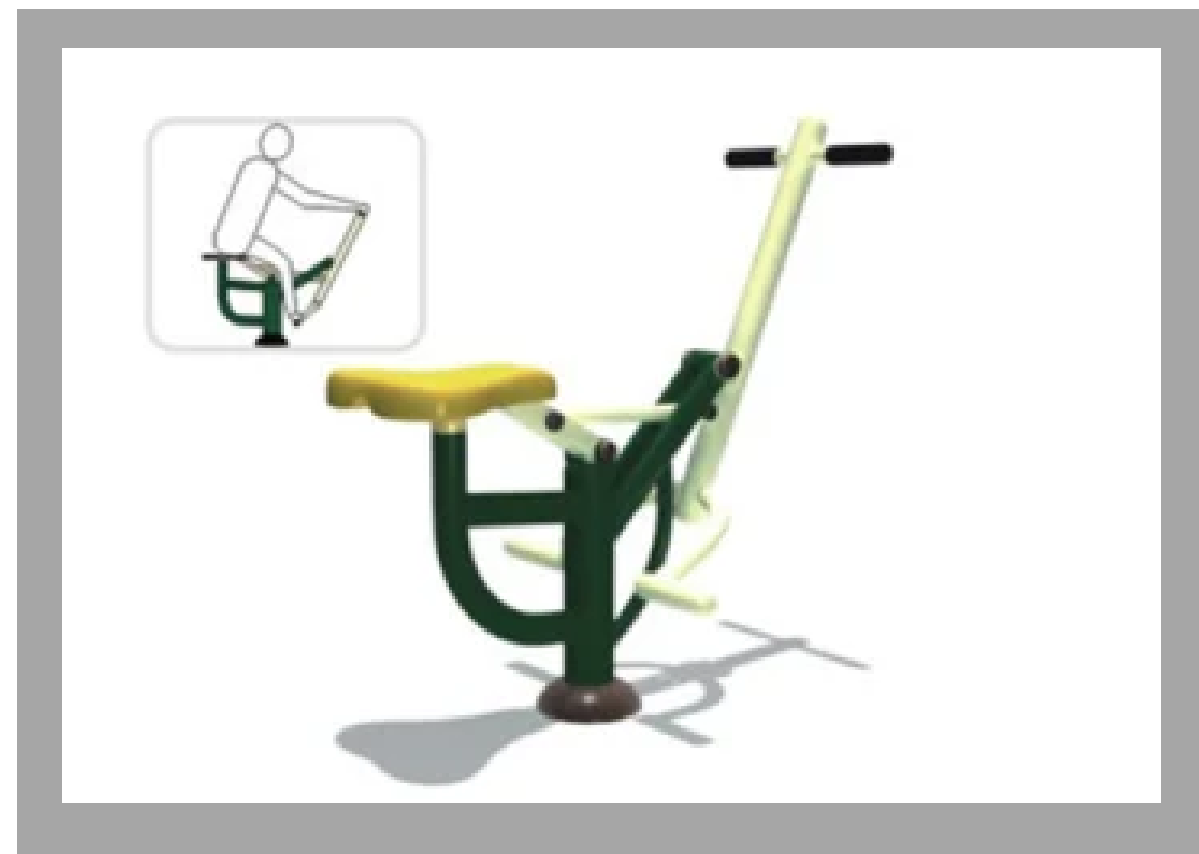
JQ-05 CABALLO 100*45*145 CM RD$ 48,450.00 (IMPUESTOS INCLUIDOS)