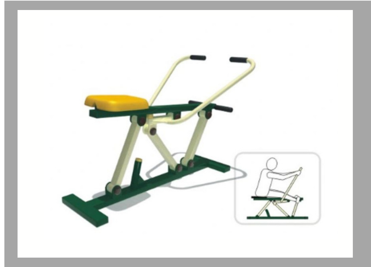
NB-01604 EQUIPO SIMULADOR DE REMO 130*85*100 CM RD$ 37,050.00