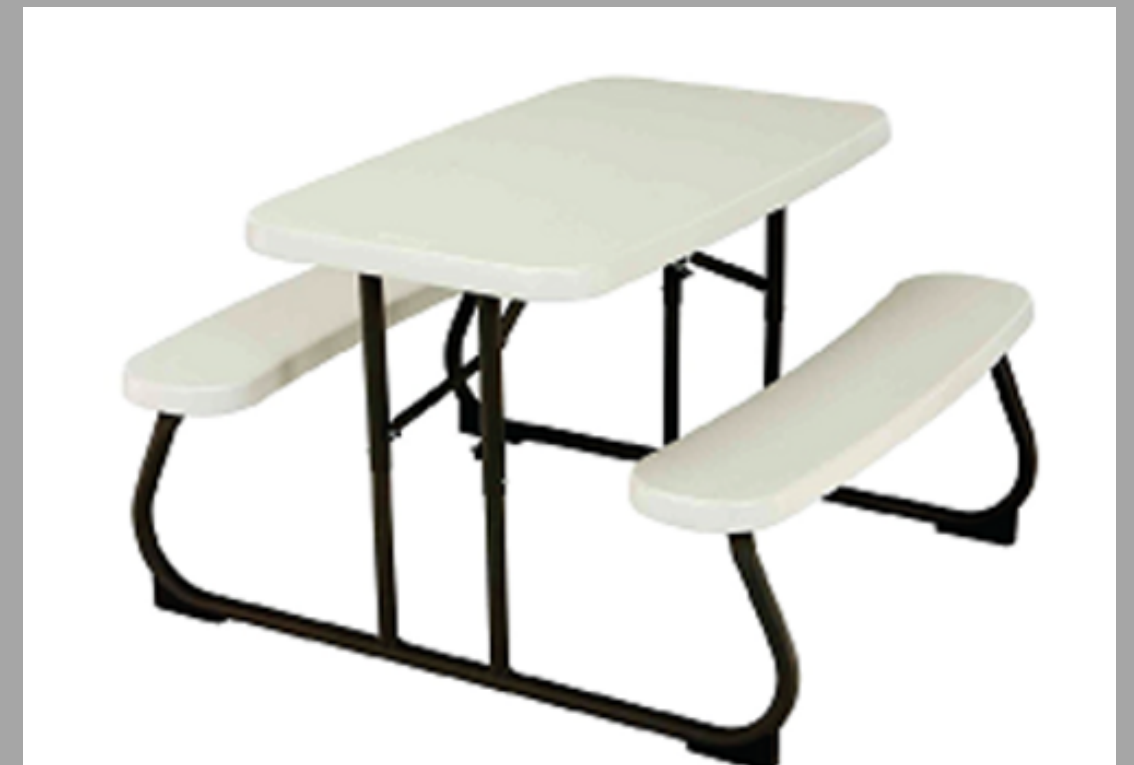
AD-43-2720 BANCO MERENDERO P/NIÑOS 32 x 19 pulgadas RD$ 4,500.00(IMPUESTOS INCLUIDOS)