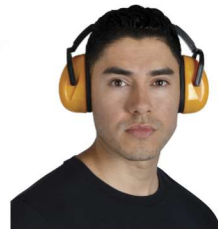
HA-111 Orejeras Antiruido de 26 dB de NRR