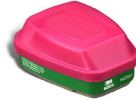
MM-60924 Cartucho Dual para Vapores (2 Piezas)