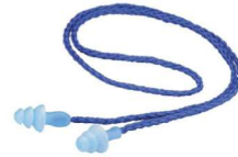
MM-1290 Tapon Auditivo Reusable con Cordón Trenzado c/100