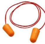
MM-1110 Tapon Expansible con Cordón (100 Piezas)