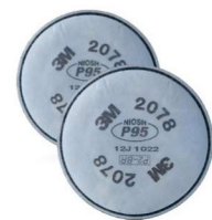
MM-2078 Filtro para Gases Ácidos y Vapores Orgánicos