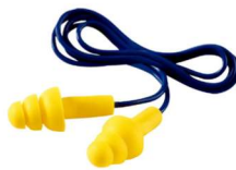
MM-340-4014 Tapón auditivo EAR™ UltraFit™ Econopack con Cordón (200 Piezas)