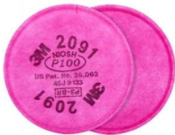
MM-2091 Filtro para Partículas (2 Piezas)