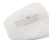
MM-5P71 Filtro para Partículas (10 piezas)