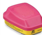
MM-60923 Filtro Mixto para Vapores Orgánicos y Gases Ácidos (2 Piezas)