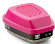
MM-60921 Cartucho Dual Vapores Orgánicos Partículas P100 (2 Piezas)