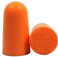
MM-1100 Tapones Auditivos de Espuma (200 piezas)