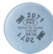
MM-2071 Filtro para Partículas (2 Piezas)