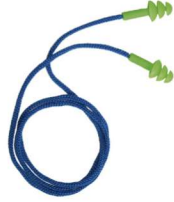
HA-SP-0071 Tapón Auditivo Reusable de 21dB de NRR (100 Pares)