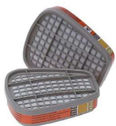
MM-6009 Cartucho para Vapores de mercurio (2 Piezas)