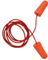
HA-SP-0068 Tapón Auditivo Desechable de 32 dB de NRR (200 Pares)