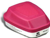
MM-60922 Cartucho Dual para Gases Ácidos/Partículas P100 (2 Piezas)