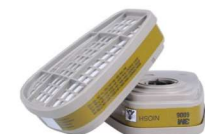
MM-6006 Cartucho para Vapores Orgánicos (2 piezas)