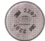
MM-2297 Filtro Avanzado P100 Contra Partículas para Vapores Orgánicos (2 piezas)