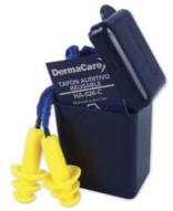
HA-026-C Tapón Auditivo Reusable con Cordón - (80 Piezas)