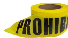
SE-PP Cinta Amarilla Prohibido el Paso 305 mts