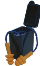
HA-SP-0072 Tapón Auditivo Reusable de 26dB de NRR en Caja (100 Pares)