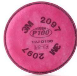
MM-2097 Filtro para Neblinas y Vapores Orgánicos (2 piezas)