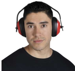
HA-110 Orejeras de 23 dB de NRR