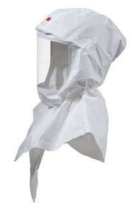
MM-S-707-10 Capucha de Reemplazo para S-757 c/10