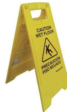
SE-IN-P Indicador de Piso Mojado