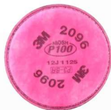
MM-2096 Filtro para Gases Ácidos (2 piezas)