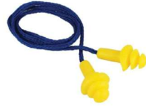
HA-026 Tapón Auditivo Reusable con Cordón - (100 Pares)