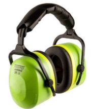
HA-SP-0067 Orejeras de 29 dB de NRR