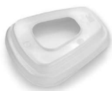
MM-501 Retenedor p/Pref (20 piezas)