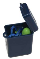
HA-SP-0073 Tapon auditivo TPR con Cordón (Caja con 100 Pares)