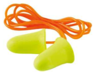
MM-312-1260 Tapón Auditivo con Cordón EARSoft FX (200 Piezas)