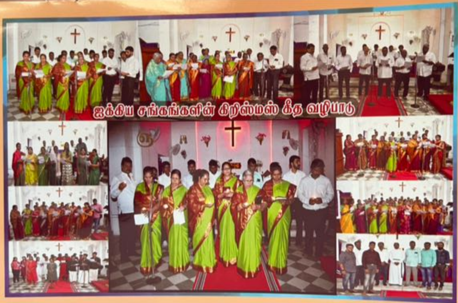
ஐக்கிய சங்கங்களின் கிறிஸ்மஸ் கீத வழிபாடு