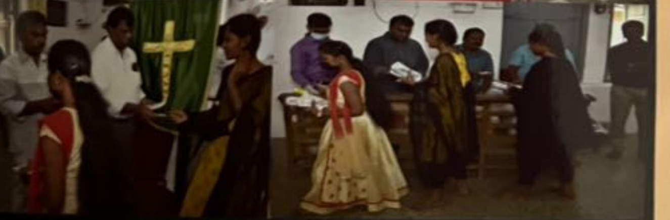
அரசு தேர்வு வழங்குவதாகான சிறப்பு ஆணைகளைக் கருகை