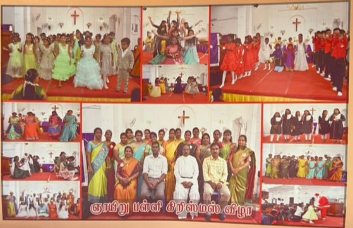
ஞாயிறு பள்ளி கிறிஸ்மஸ் விழா