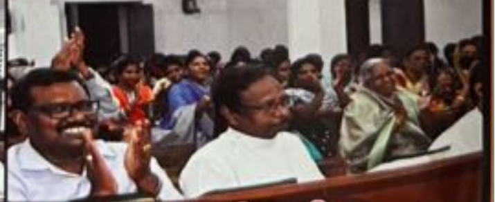
பெத்தலையில் ஒரு கவியரங்கம்