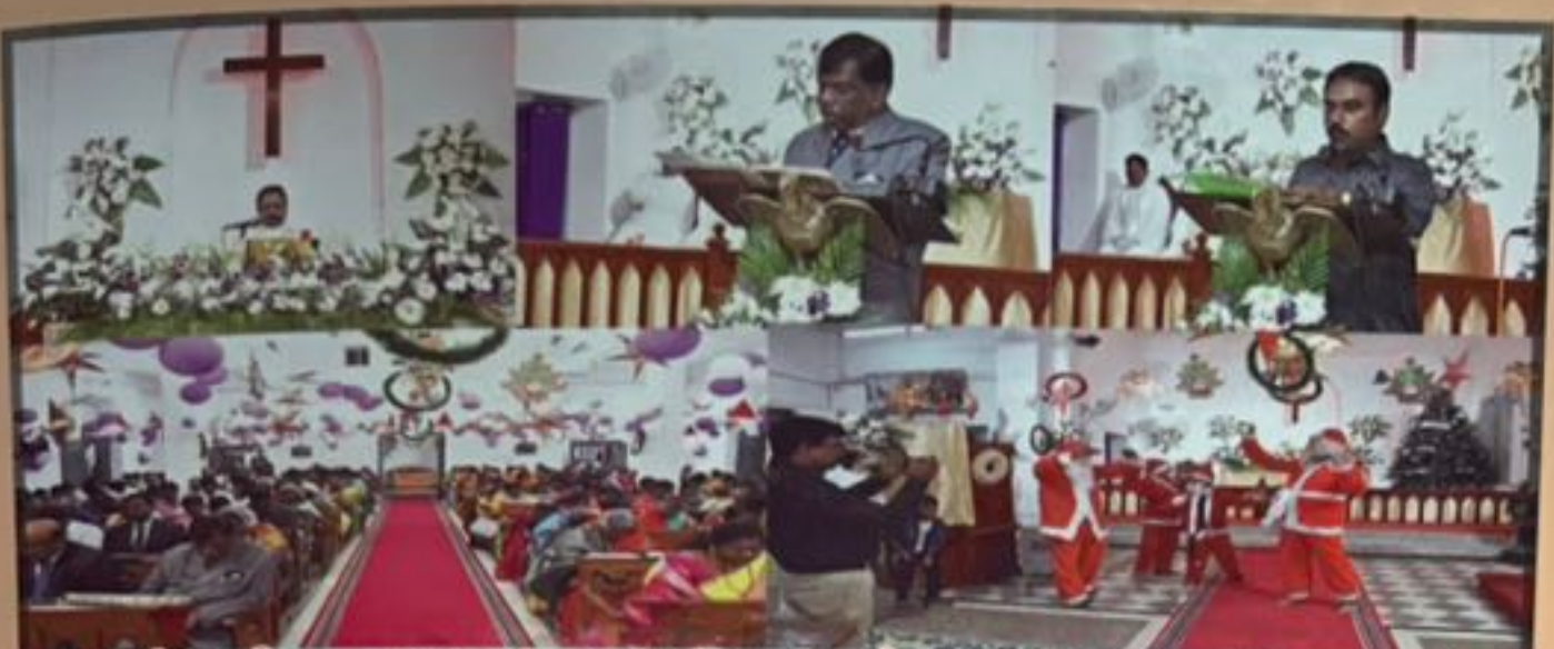
கிறிஸ்தமஸ் - 2022 & புதிய ஆண்டு 2023 வழிபாடுகள்