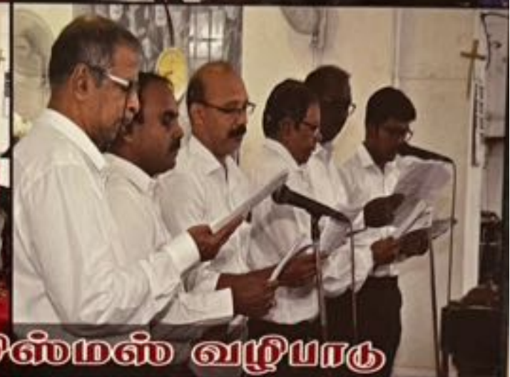
பாடகர் குழு கிறிஸ்தம்ஸ் வழிபாடு