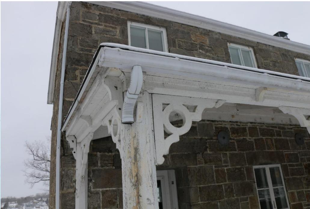
Maison du surintendant à Carillon (Québec)

La conservation des biens patrimoniaux fédéraux, 2018 (suite)