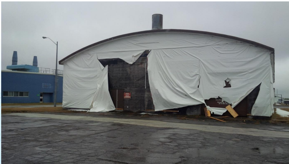
Hangar 13, à la base des Forces canadiennes de Borden (Ontario)

La conservation des biens patrimoniaux fédéraux, 2018