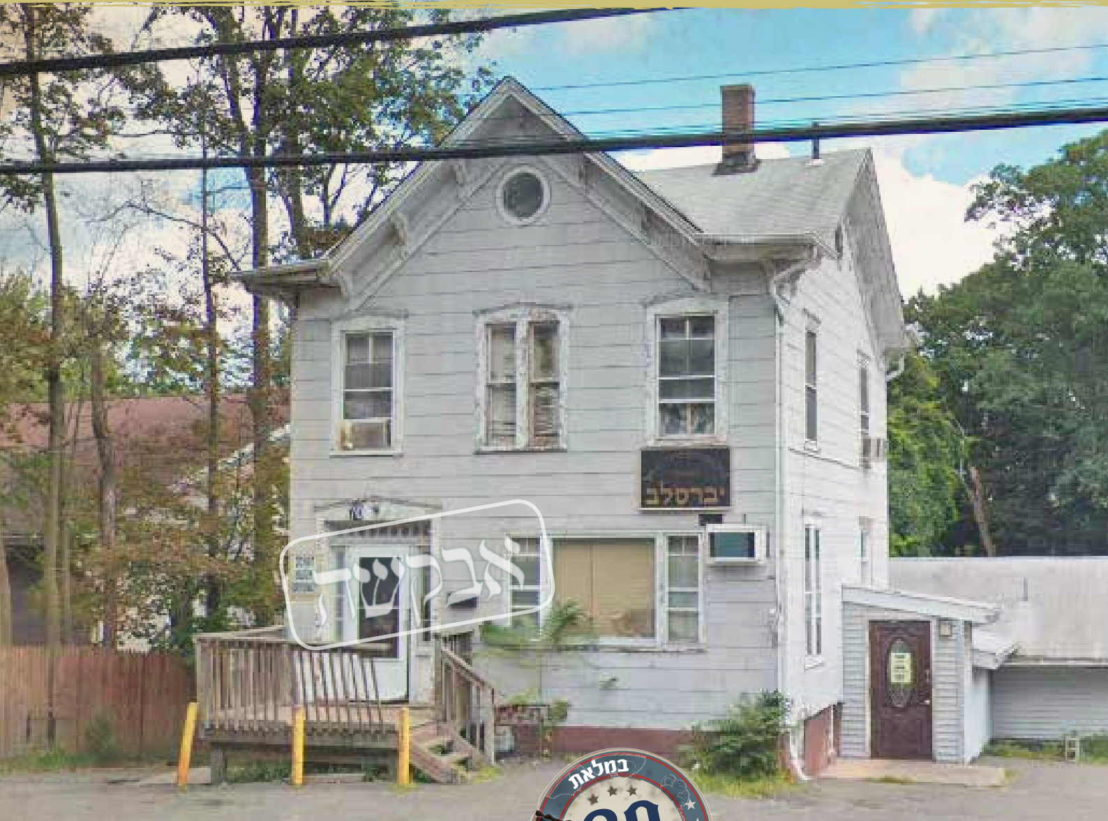
בית המדרש ברכת הנחל כיום