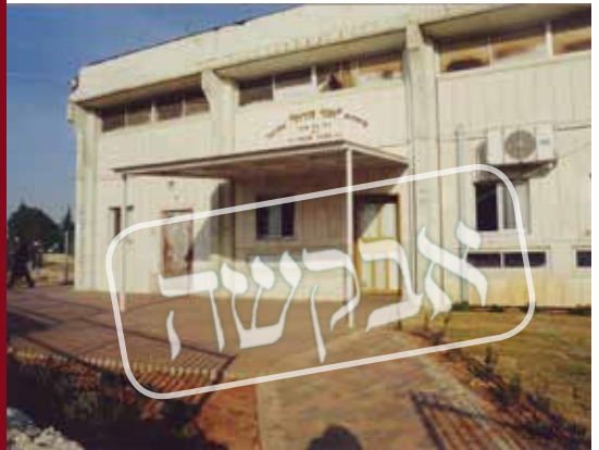
מתקיימים מניינים וסודרי לימוד. בית המדרש אור זורח בעמנואל

והתחלתי להסתובב אנה ואנה. פסעתי ברחוב פושקינא הלון וחזרו ולא ידעתי מה עלי לעשות, כיצד אצליח בשעה כה מאוחרת לחזור לקייב הבירה?