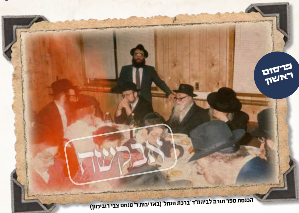
הכנסת ספר תורה לביהמ"ד 'ברכת הנחל'

בשלימות, ועל ידכם יתפשט אור ודעת רבינו ז"ל בעולם עדי נזכה לגאולתינו ופדות נפשינו בביאת משיחנו במהרה בימינו אמן.