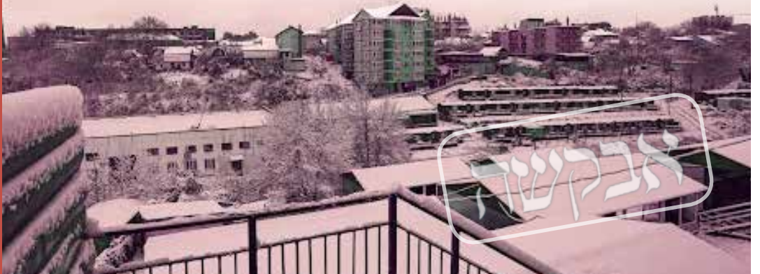
מבנה חד-קומתי אחד ישנו באומן, שם אין לאגנרל חורף' דריסת רגל. השלג בתקופת החורף באומן

"מאומן חזר יואלי בן אדם אחר לגמרי. עם 'אורות גבוהים' כמו שקוראים לזה..." עכשיו תורו של שמילי לספר. "מיד אחרי שהוא נחת, הוא חייג אלי בהתרגשות ואמר שאני חייב לבוא איתו לאומן... הוא אמר לי שאין עוד מקום כזה, ואני חייב לבוא לשם לחוות את זה מקרוב. העמדתי אותו על מקומו, והבהרתי לו בצורה הכי ברורה שאני האחרון שיסע עכשיו לאומן... הייתי באותה תקופה רחוק לגמרי משמירת התורה, ניהלתי בית ללא שום סממן יהודי, לא שבת, לא כשרות, כלום! אז מה ההגיון לנסות לסחוב אותי לאומן?! הסברתי את זה ליואלי, והוא, שהבין שהוא עלה על מוקש,