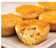
Empada de Frango