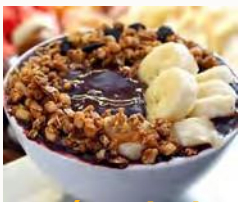
Açaí na tigela

Extra: Hora de conhecer algumas delícias encontradas no Brasil =D