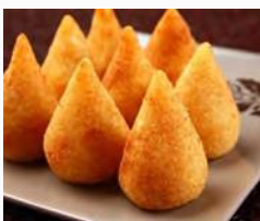
Coxinha de Frango