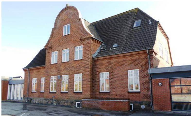
3 Villa Vangen, i dag Vejen Business College.

I november 1951 var der mund- og klovsyge her i landet. Det spredte sig som en steppebrand, og smitten kom også til Grønvangs fine malkebesætning (rød dansk malkerace), der leverede børnemælk til Grønvangs mælkeudsalg i Nørregade. (se under Nørregade 53). Mælken måtte nu p.g.a. smittefare ikke leveres. Der blev lavet afspærringer ved alle veje til gården. Der måtte slet ikke være nogen trafik til og fra gårde