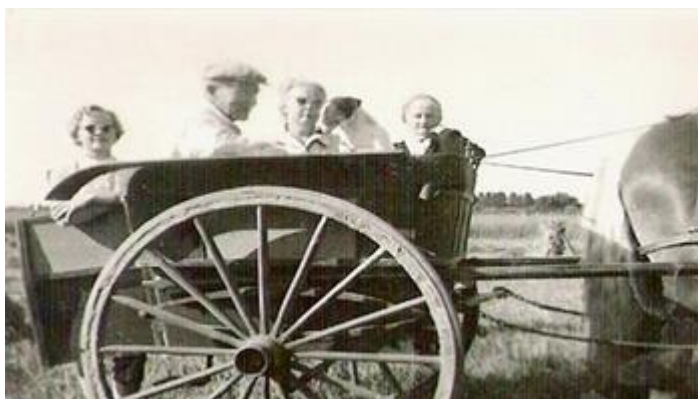
4 På vej til høstfolkene i jumbe med mad og drikke ca.1953.

I sommerferien hjalp jeg til hjemme med alt forefaldende, bl.a. bærplukning og i køkkenet, når pigerne på skift havde ferie, ja det havde man også dengang, selvom det slet ikke var så organiseret som nu. Vi havde mange feriegæster i sommerens løb. Mine forældre var meget gæstfri og i den periode vi var på Grønvang,