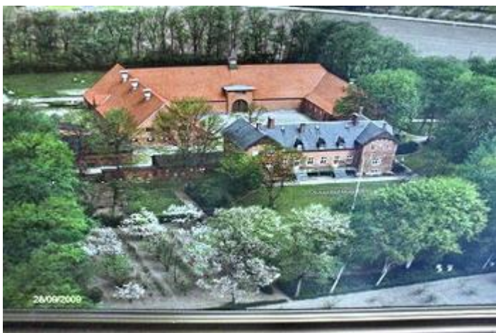
1 Grønvang 1951, set fra syd.

Da jeg er den nulevende, der sidst har boet på "Grønvang", mens den stadig var en fuldt drevet stor gård, og da det måske også kunne have en vis lokalhistorisk interesse for Vejen, har jeg valgt at lægge denne beretning under "Erindringer" på Vejen lokalhistoriske forenings hjemmeside.