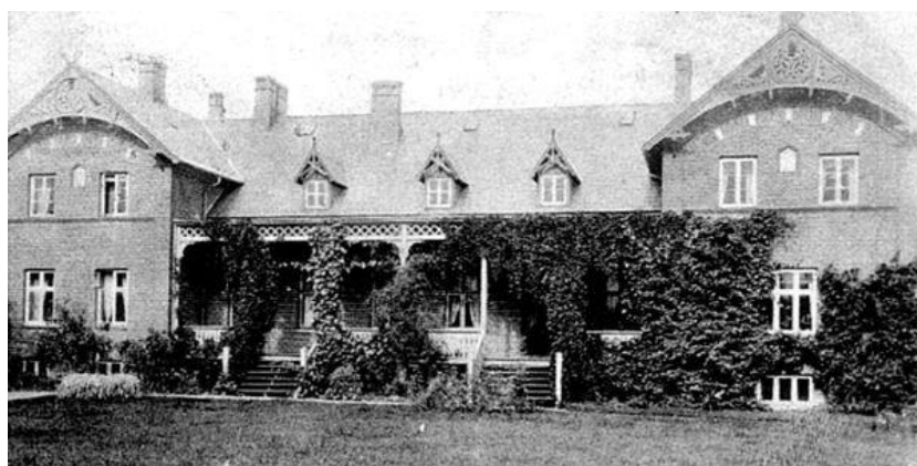
2 Grønvang fra havesiden.