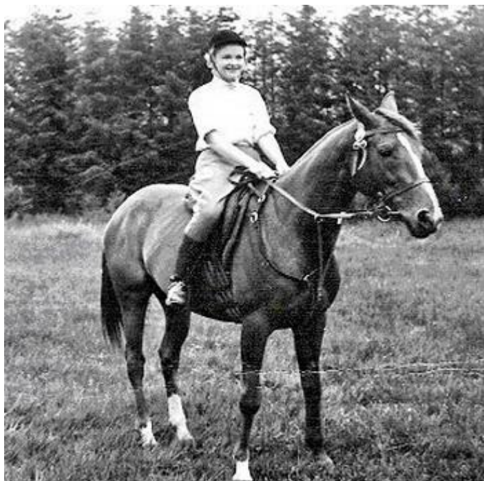
6 "Mikkeline" med mig ca. 1957