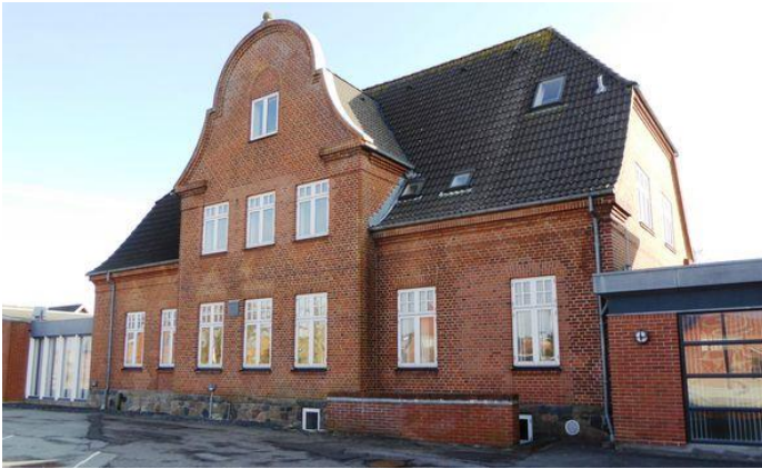
1 Villa Vangen