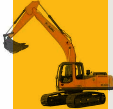
Xcmg 210 Ekskavatör