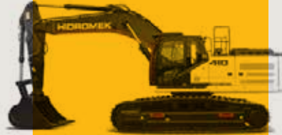
Hidromek 410 Ekskavatör