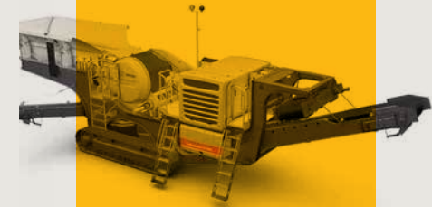
Metso Konkasör Taş kırma