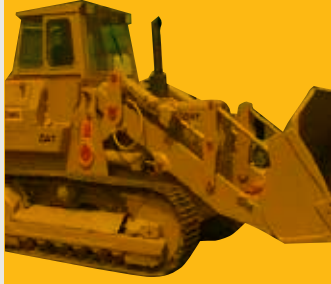
955 Cat Dozer