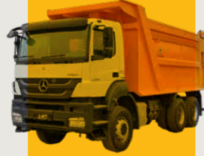
Mercedes Damperli Tır