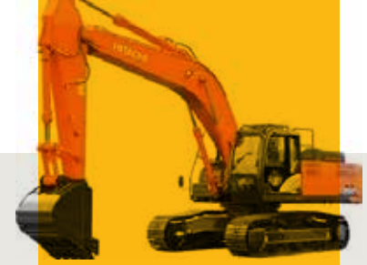
Hitachi 350 Ekskavatör