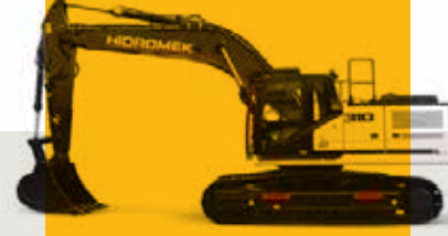
Hidromek 310 Ekskavatör