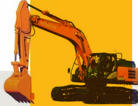
Hitachi 300 Kırıcıllı Ekskavatör