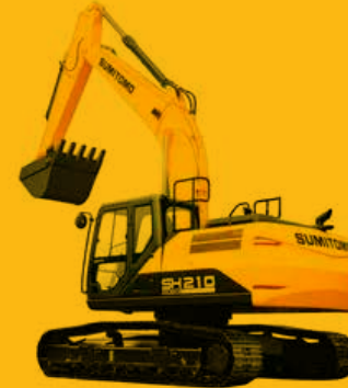
210 sumitomo Ekskavatör