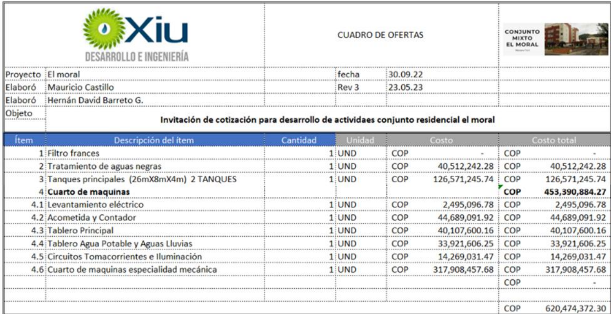
Tabla 1; Tabla estimada de costos.

Los valores descritos en la tabla de costos no incluyen IVA Se hará un máximo de 2 revisiones de los planos por observaciones del cliente. El equipo técnico para el desarrollo de este proyecto es el siguiente: