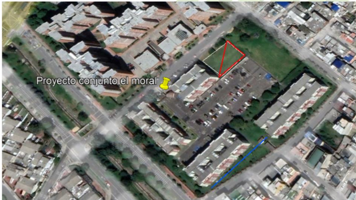
Tabla 3, Estimación de costos por actividad y detalle de los hitos del contrato para tratamiento de aguas negras.