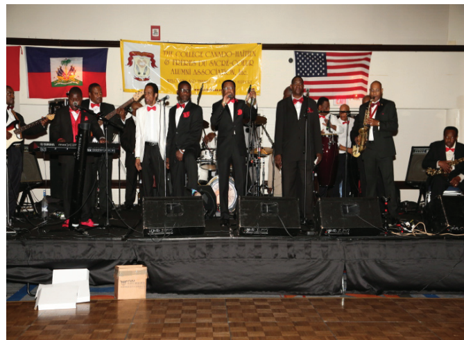
Retro Band performed wonderfully.