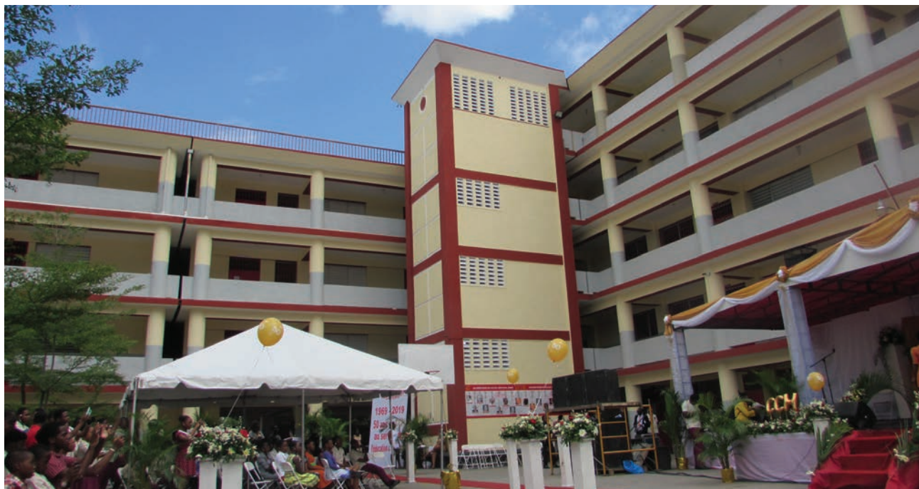
Le nouveau bâtiment du Collège Canado-Haitien