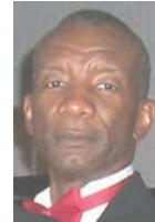
A Registered Representative of PFS Investments Inc.

TRUST IN ME -TO- HELP GUIDE YOUR FINANCIAL FUTURE