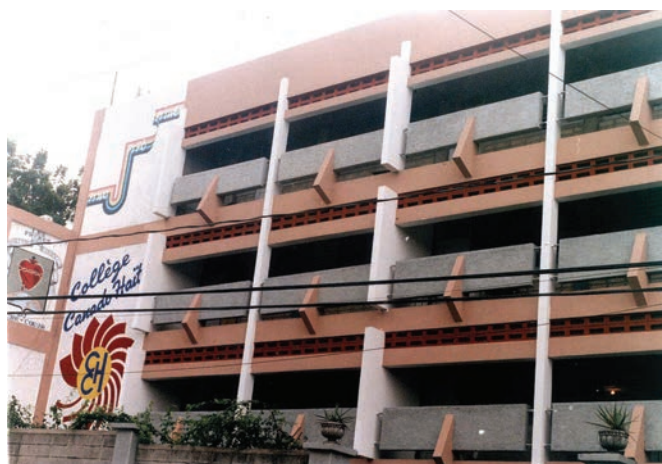
Le bâtiment du Collège Canado-Haïtien avant le séisme du 12 Janvier 2010