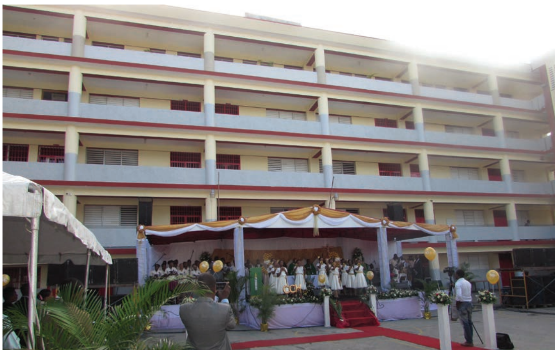
The Canado Secondary School celebrating its 50th anniversary.

By Fr. Augustin Nelson, SC (Translated from French by Jean-Claude Bailey)