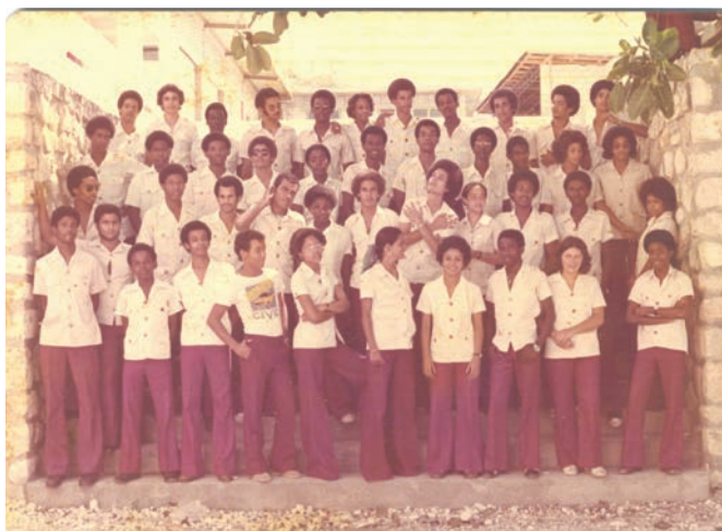
Un groupe de la promotion 1978 (Science).