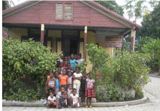
CEFLB (Centre d'Éducation et de Formation Louis Bellabe) in Chantal, Haiti.