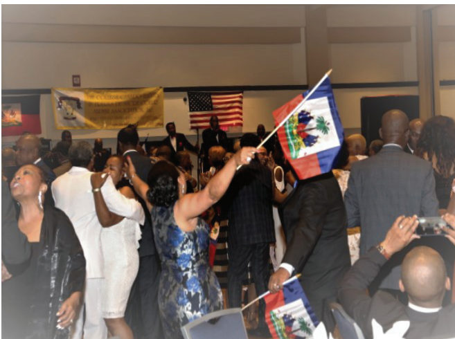
Flag Dance ambiance, as animated as ever.