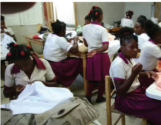
Lagumite School: Sewing training for the young ladies.

Thank you in the name of all the beneficiaries.