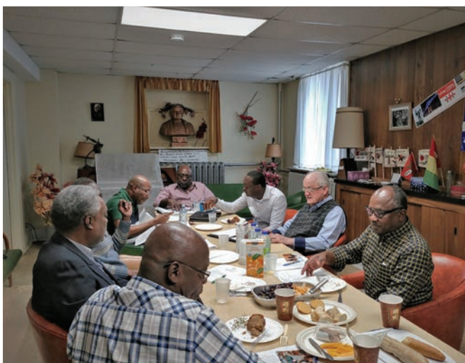
Lamikal-Canada: L'équipe au travail.

Félicitations à la Fondation pour le bon travail accompli et à venir!.