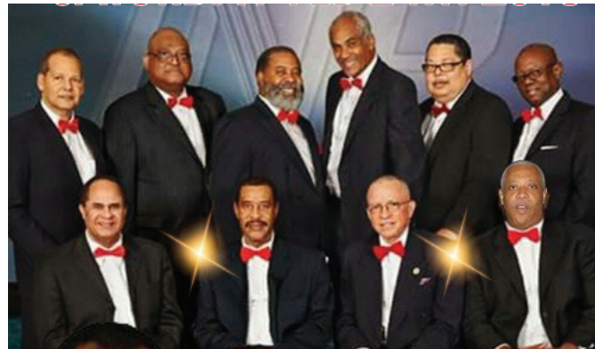
PNP-Plezi'n Nap Pran (2004-2019) – 15 years of Excellence.

PNP Management: can be reached at either or: www.pnpmusique.com (786) 316-8518 edaltine@aol.com