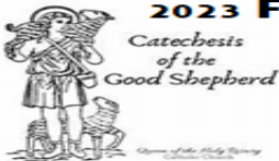
Catechesis of the Good Shepherd

Elementary / Escuela Primaria (Kinder thru Sixth Grade - Kinder a Sexto Grado)