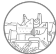
حي الطريف في الدرعية التاريخية