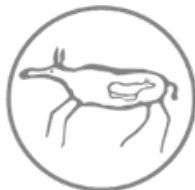
الرسوم الصخرية في حائل