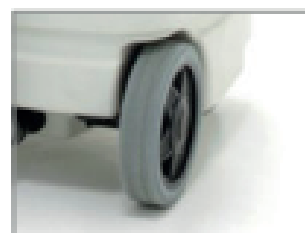
RUEDAS GRANDES CON BANDA DE GOMA