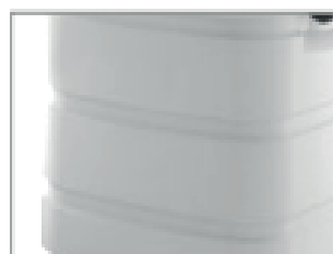
DEPÓSITO DE PLÁSTICO ALTAMENTE RESISTENTE