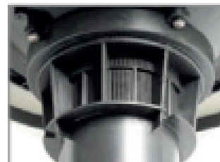
SISTEMA ANTIESPUMA INTEGRADO