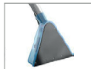
BOQUILLA PARA ALFOMBRA