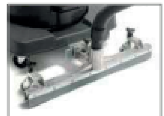
ACCESORIO FLUJO OPCIONAL