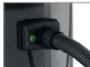
LA MANGUERA FLEXIBLE ESTÁ BLOQUEADA DE FORMA SEGURA