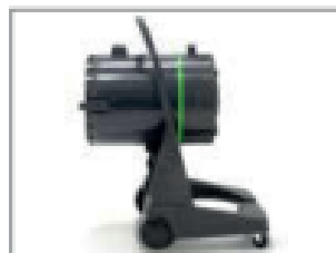
DEPÓSITO DE VOLTEADO