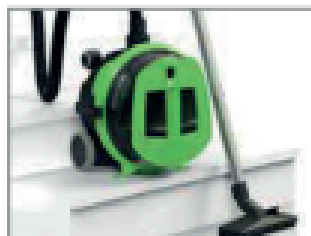
POSICIÓN DE ESTACIONAMIENTO EN ESCALERA