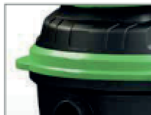
PROTECCIÓN LATERAL PARA PUERTAS Y PAREDES