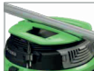
ASA ERGONÓMICA CON PORTACABLE INTEGRADO