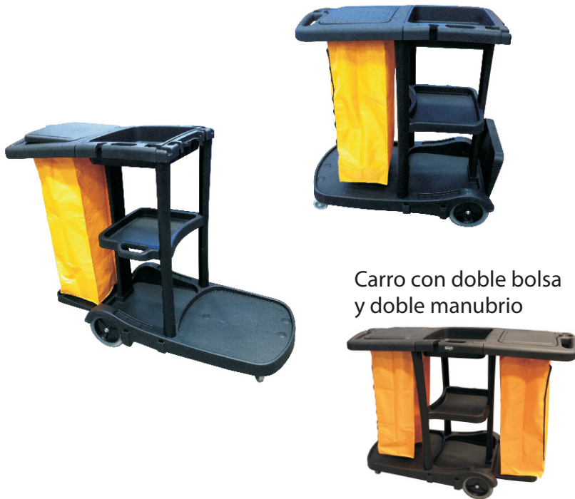
Carro con doble bolsa y doble manubrio