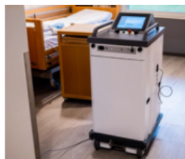
Roboten sprøyter ut hydrogenperoksid som desinfiserer rommet.

Luftrenseren som selskapet Ventitech leverer er filterfri. Et plasma med oksidanter frigjøres og spres ut i rommet. Disse skal ifølge selskapet ha effekt på forurenset luft og overflater. Teknologien er i utgangspunktet utviklet for romferd av Nasa.