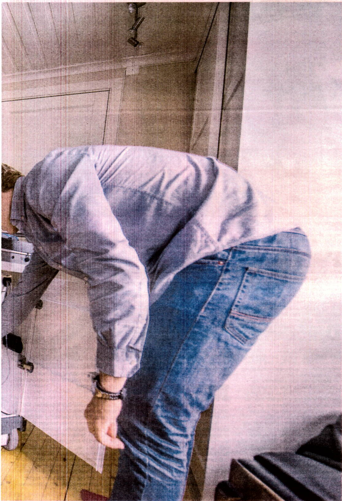
Olaf Tufte følger med fra siden.

S elv om han er veltrent som få, har vært i fem OL og har overarmer så store som tømmerstokker, kan et ørlite feilskjær sende OL-drømmen i vasken. Størrelsesmessig er det David mot Goliat, men en mikroskopisk bakterie kan være nok