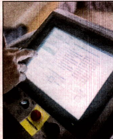
«PREPARING DISINFECTATION»: På denne skjermen plottes Singstad inn hvilke stoffer som skal slippes ut i rommet.

unger og treffer folk hele tiden. De mest hysteriske kan ikke hilse på folk en gang. Det er ikke farlig. Etter at jeg har hilst på dere, trenger jeg ikke pirke meg i tennene og plukke meg i nesen. Det er bare å bruke Antibac når dere har dratt, sier han.