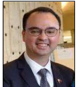
Former House Speaker Alan Peter Cayetano