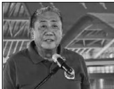
(DOTr) Secretary Arthur Tugade

Aniya, malaki ang maitutulong ng naturang imprastruktura para sa economic growth ng Laguna dahil bukod sa pagkilalang ‘Resort Capital of the Phil-