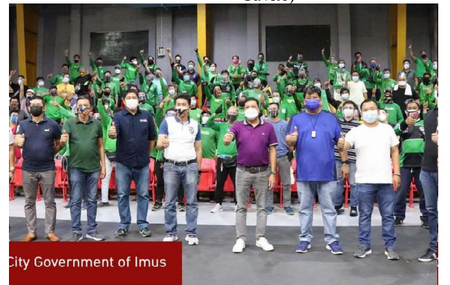
City Government of Imus

Kasabay naman ito ng pagbabakuna sa mga senior citizens sa patuloy na pag-arangkada ng Tutok Seniors. (City Government of Imus FB Page/PIA-Cavite)