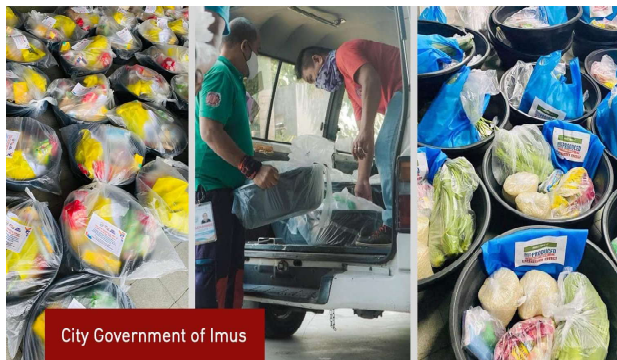
City Government of Imus

Sa pangunguna ng Imus City Disaster Risk Reduction Management Office (CDRRMO), muling nagbahay-bahay ang Pamahalaang Lungsod upang maghatid ng ayuda sa mga naka-home quarantine na Imusen-ong positibo sa COVID-19. Hangad ng lungsod na tugunan ang pangangailangan ng mga Imusen-ong hindi makalabas ng kanilang mga tirahan habang tinitiyak ang kaligtasan ng kanilang buong komunidad. "Mula sa tala