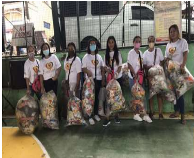
Attendees of Juan Goal for Plastic in Cavite bring their used plastics to the waste collection event.

"Our ambition to become a sustainable global enterprise has been steadfast and resolute, amid lingering challenges and the steady reopening of economies," Lee said. "The plans that we have set in motion are bringing us closer to our goals." (PR)