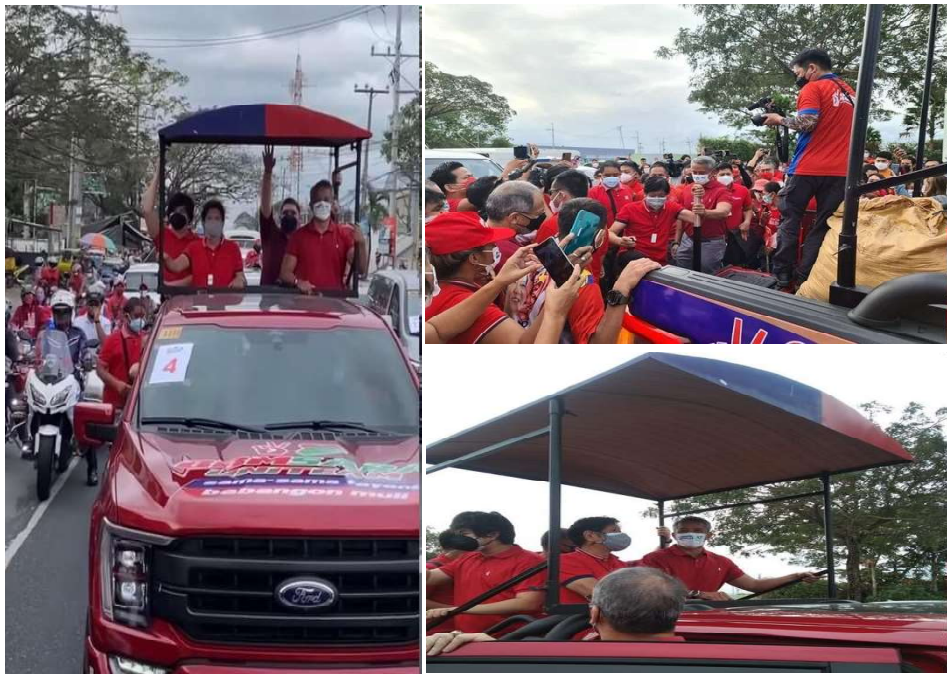
Ginaganap noong Biyernes sa lalawigan ng Cavite ang caravan ni Presidential Aspirant Bong Bong Marcos kung saan makikita na kasama niya si Cavite Governor Jonvic Remulla.

Ang naturang caravan ay iikot mula sa bayan ng Tanza hanggang sa General Trias City.