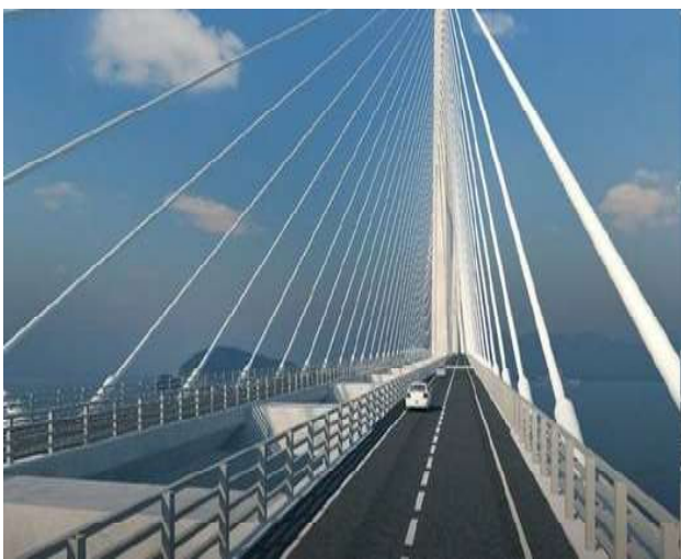
inter-agency steering committee meeting upang bigyang-daang ang mga mungkahi, ideya, isyu, at alalahanin ng mga stakeholder sa pagtatayo ng tulay.

Aniya, ang proyekto ay magbibigay ng mas maraming oportunidad para sa ekonomiya at turismo ng lalawigan at gayundin ay magtataguyod ng mataas na kalidad ng pamumuhay para