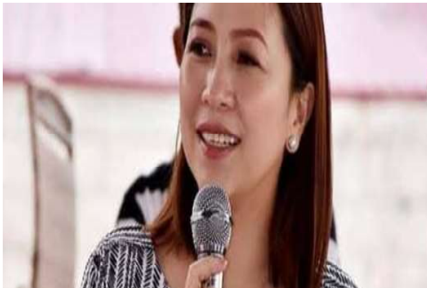
Mayor Jenny Austria-Barzaga

"Hindi naman natin maaaring i-shortcut ang proseso upang mapaboran lamang ang hiling ng programa ni Ginoong Tulfo o ano pa mang parehong programa sa telebisyon o radyo," dagdag niya.