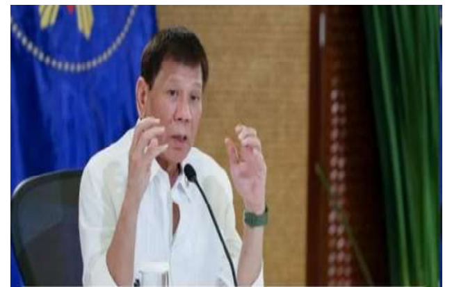
PRESIDENT RODRIGO DUTERTE

"The invitation is for all so that we can have an exchange of ideas between