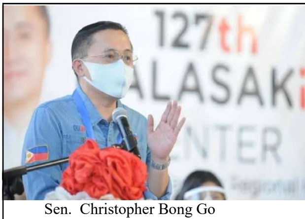
Sen. Christopher Bong Go

Bong Go ang may akda ng Malasakit Centers Act na nilagdaan naman ni Pangulong Rodrigo Duterte noong Disyembre taong 2019 upang mabigyan ng medical assistance ang mga benepisyaryo ng nasabing programa.