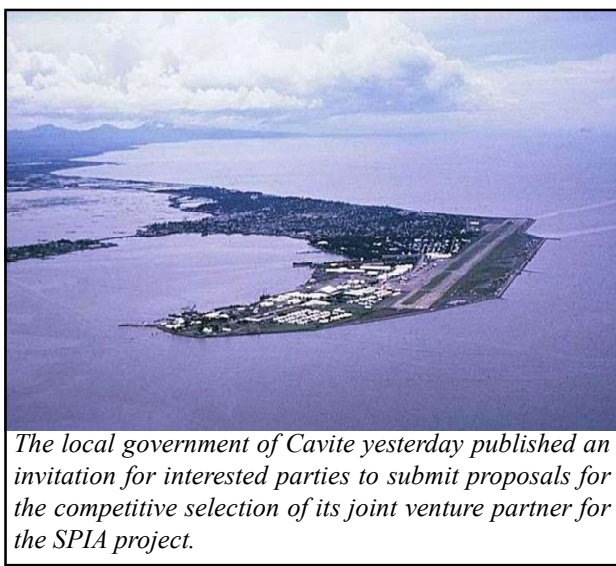
The local government of Cavite yesterday published an invitation for interested parties to submit proposals for the competitive selection of its joint venture partner for the SPIA project.