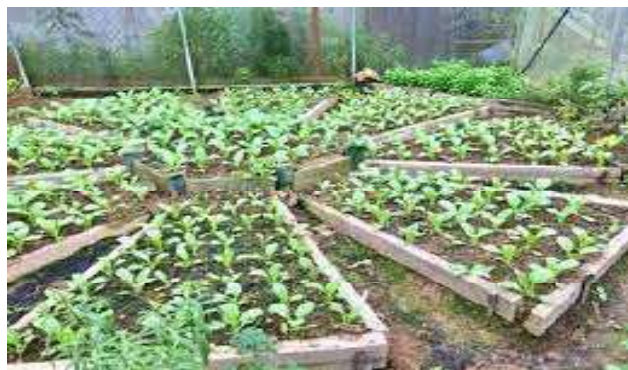
Vegetable garden

“The communal garden will help build a good community, add to the promotion of a healthy lifestyle, and will give therapeutic