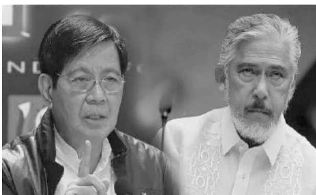
senator Panfilo 'Ping' Lacson at Vice presidential candidate Vicente 'Tito' Sotto III

na bibigyan ng P1 billion taunang development fund ang bawat probinsya sa bansa, P100 million para sa kada siyudad, P50 million sa bawat munisipalidad, at P5 million sa 42,406 na barangay bansa.