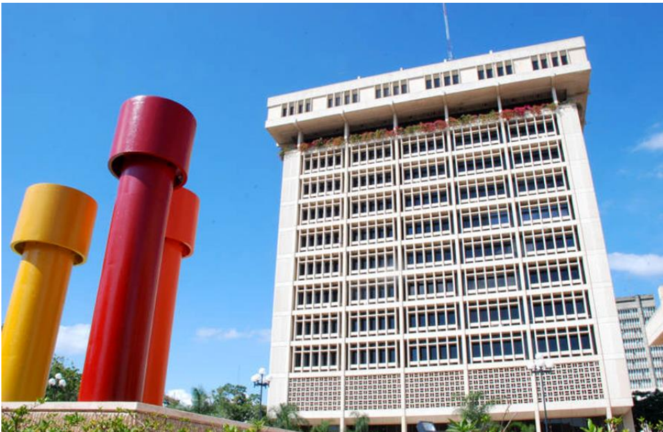
Imagen del Banco Central de la República Dominicana.

Los obreros y los campesinos, juntos con las fuerzas auténticamente marxista-leninistas, debemos estar muy atentos al discurrir de la economía dominicana, pues si sobreviene la crisis, todos unidos debemos empujar el gobierno corrupto para que caiga, y para que las fuerzas progresistas tomemos el poder político y desde éste materializar las transformaciones que exigen los explotados.