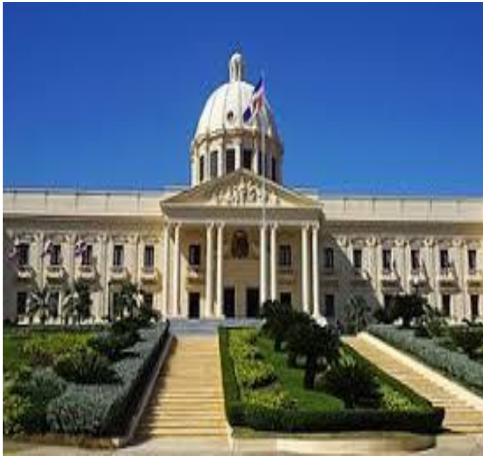
Imagen del Palacio Presidencial de la R.D.