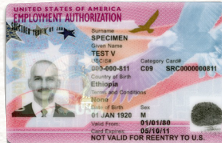
FOTOS DE PASAPORTE 2x2