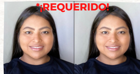
Standard: US - Passport & Visa, 2022-04-1 www.idphoto4you.com