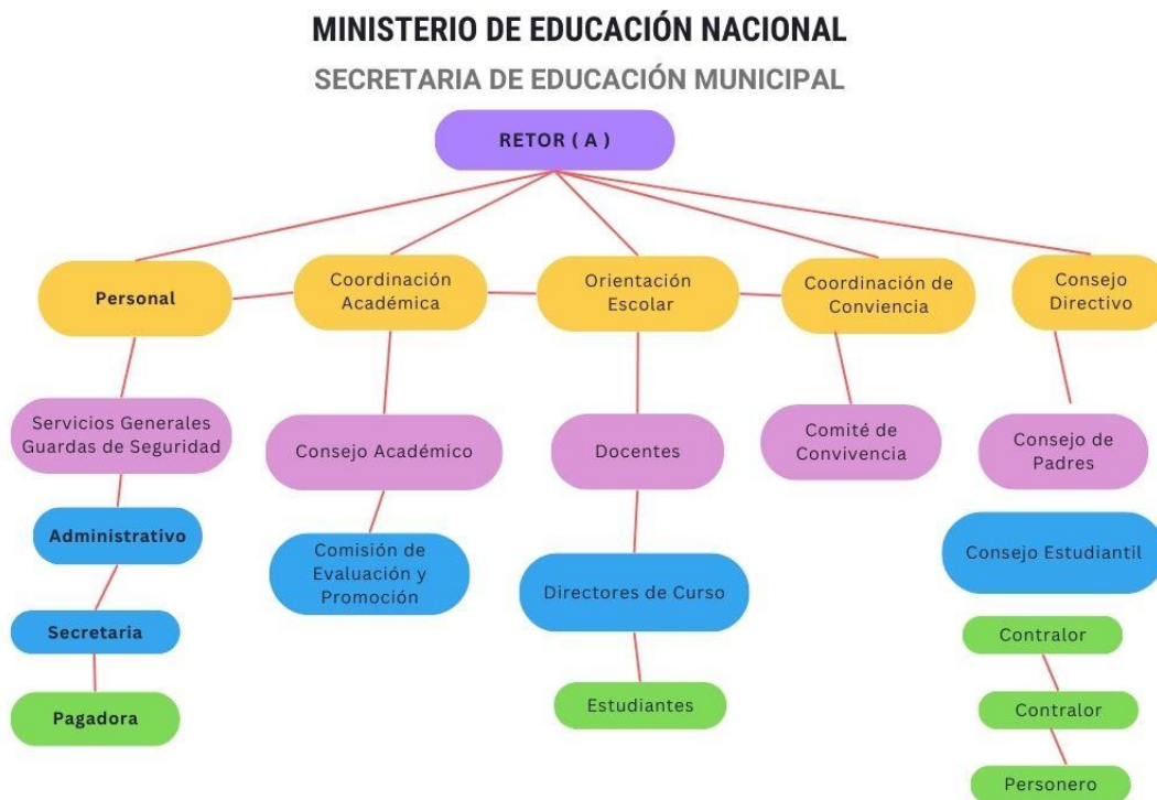
Imagen 4. Organigrama