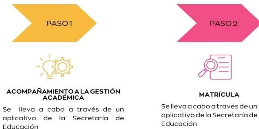
Tabla 5. Proceso Matrícula