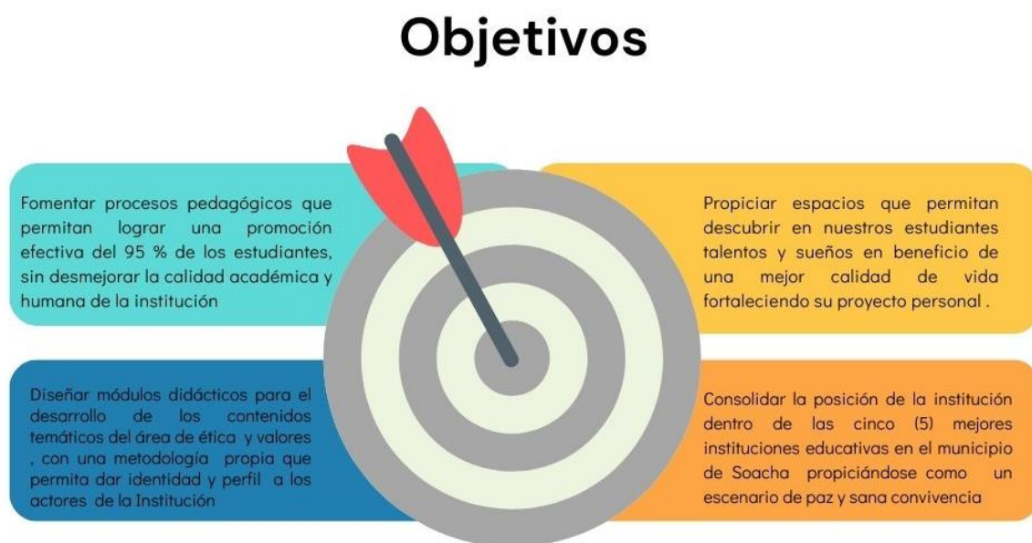
Imagen 3. Objetivos PEI

Propiciar espacios que permitan descubrir en nuestros estudiantes talentos y sueños en beneficio de una mejor calidad de vida fortaleciendo su proyecto personal