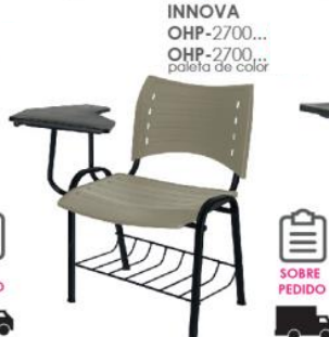
INNOVA OHP-2700... OHP-2700... paleta de color