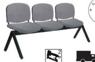
ELLITICO OHR-2200-2P OHR-2200-3P OHR-2200-4P OHR-2200-5P 2P y 5P sobre pedido