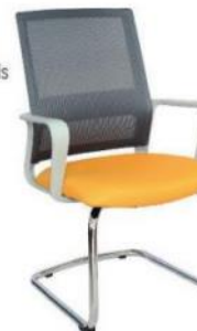
SLING OHV-94Plus Gris