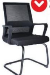
SLING OHV-94Plus Negro