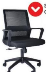
SLING OHE-94Plus Negro