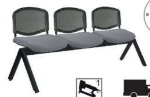
ELLITICO NET OHR-2400-2P OHR-2400-3P OHR-2400-4P OHR-2400-5P 2P y 5P sobre pedido