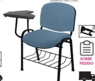
ELLITICO OHP-2200... OHP-2200... paleta de color