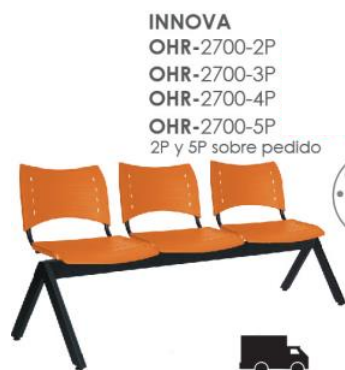
INNOVA OHR-2700-2P OHR-2700-3P OHR-2700-4P OHR-2700-5P 2P y 5P sobre pedido