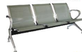
IVY OHR-2800-3Pcr OHR-2800-4Pcr