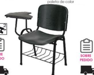
ELLITICO OHP-2600... OHP-2600... paleta de color