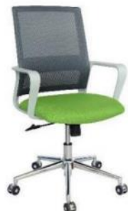
SLING OHE-94Plus Gris