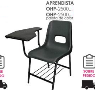
APRENDISTA OHP-2500... OHP-2500... paleta de color