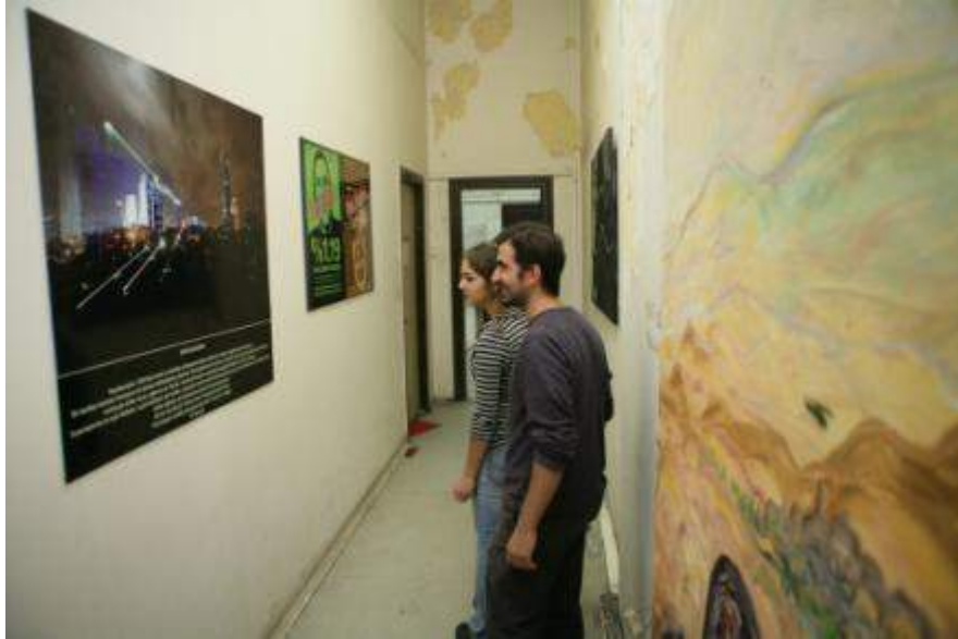
Sümerbank karma sergisinden